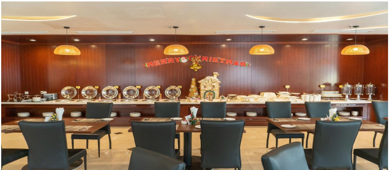
phòng ăn và quầy bar