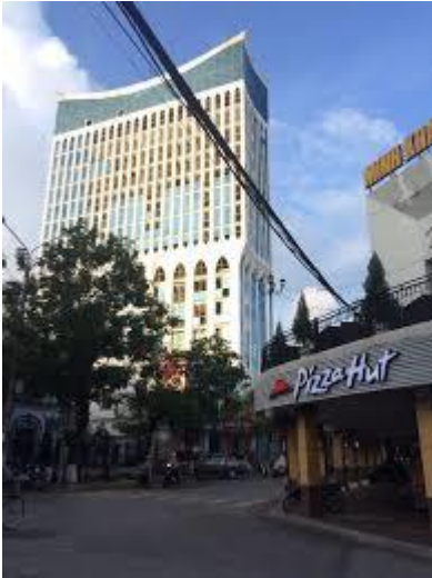
Khách sạn Imperial Boat