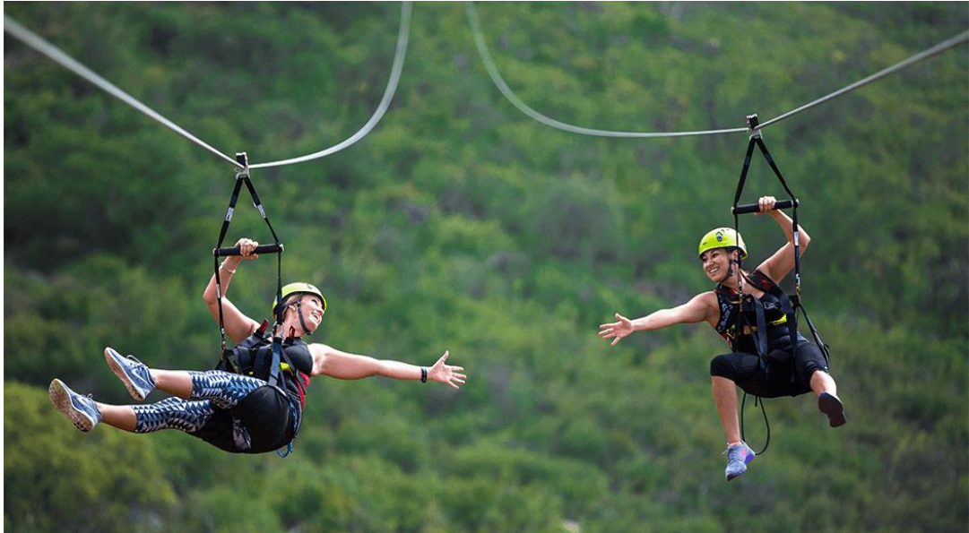
Hình 07. Zipline