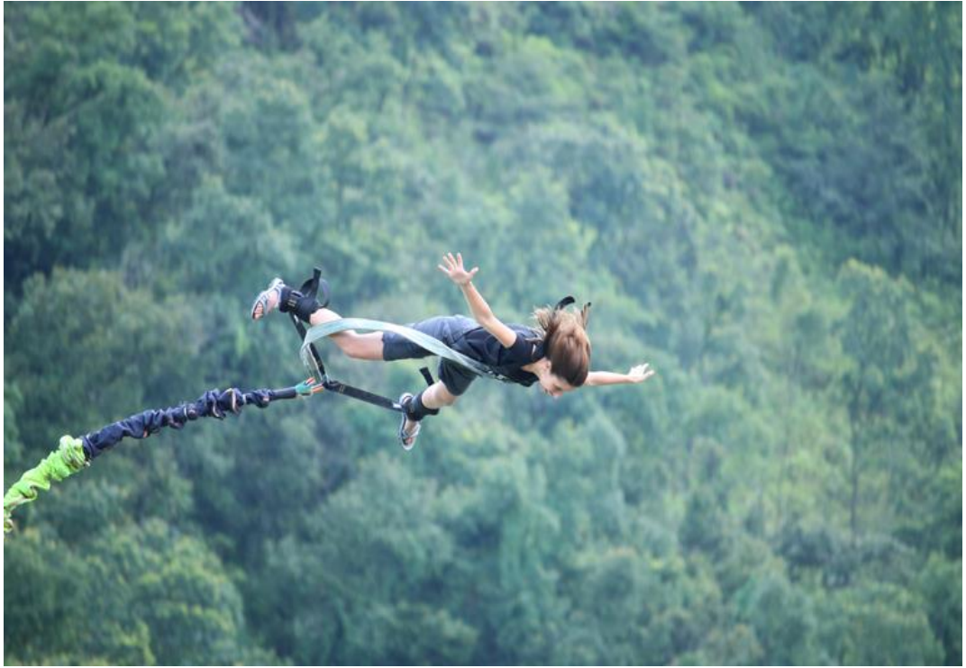
Hình 05. Nhảy Bungee