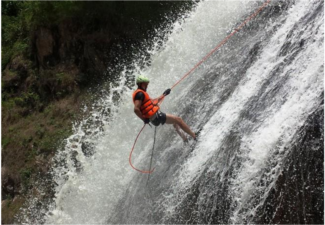
Hình 03. Đu dây vượt thác