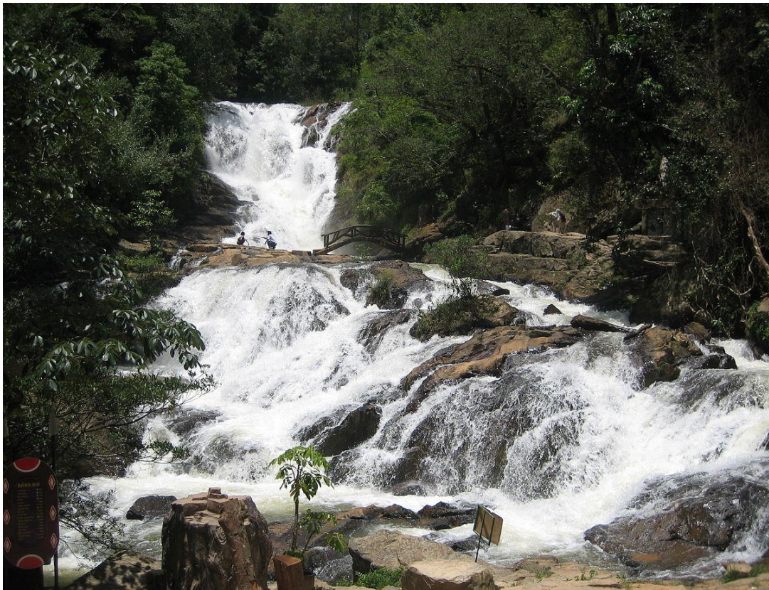
Hình 08. Thác Dantanla