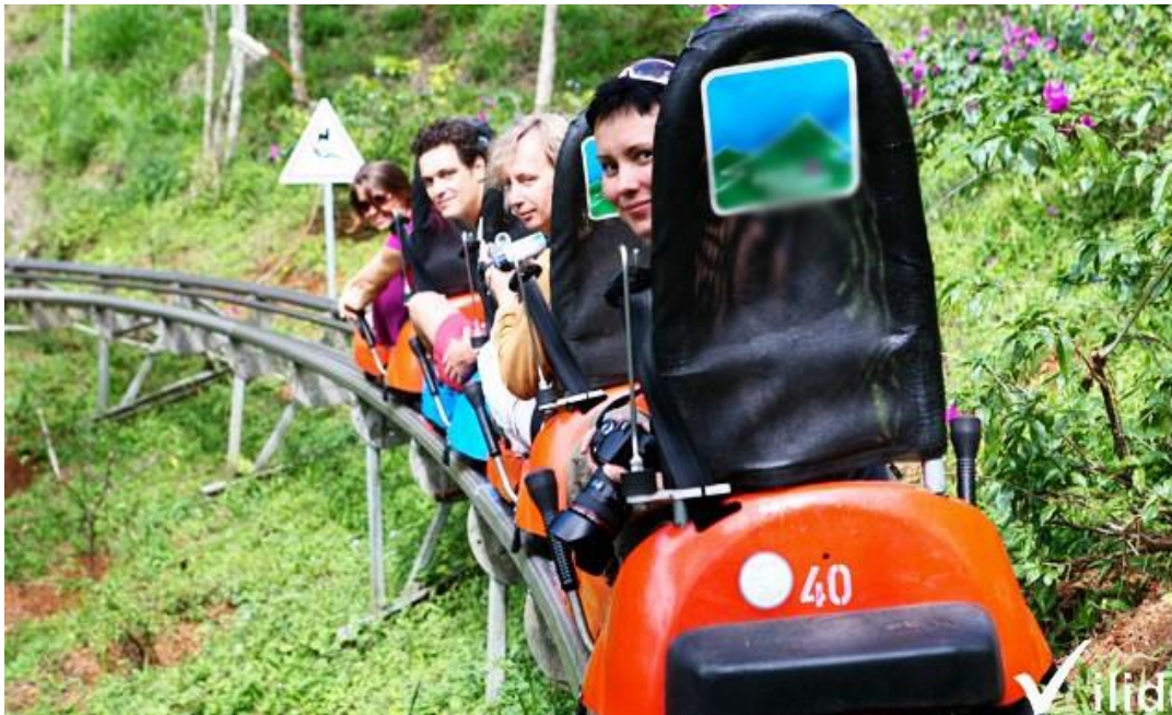
Hình 06. Trượt máng