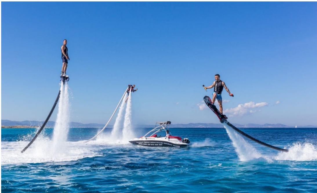
Hình 04. Flyboard