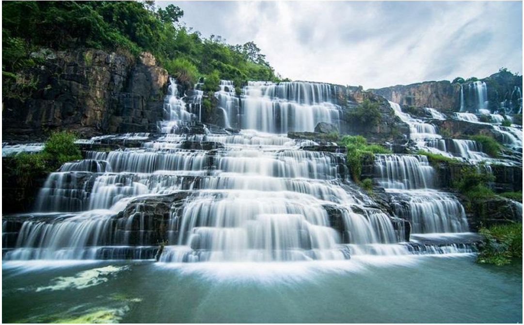
Hình 09. Thác Pongour