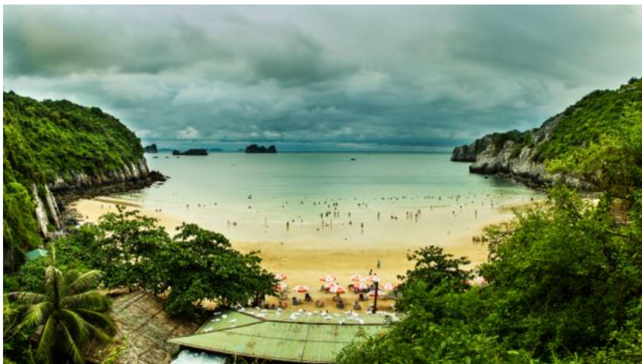
Bãi tắm Cát Cò 2

Ngay trong năm đầu tiên thực hiện Nghị quyết 08-NQ/TW ngày 16/1/2017 của Bộ Chính trị (khóa XII) về phát triển du lịch trở thành ngành kinh tế mũi nhọn, du lịch Cát Bà đã có bước chuyển mình nhanh chóng, vượt trước 3 năm về chỉ tiêu thu hút khách du lịch do Đại hội Đảng bộ huyện Cát Hải đề ra cho giai đoạn 2015 - 2020.