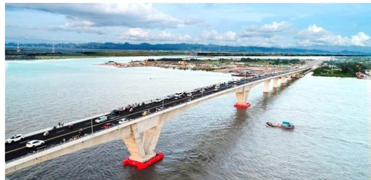
Cầu Tân Vũ - Lạch Huyện đã giúp du lịch Cát Bà khắc phục tính mùa vụ

Năm 2017, lượng khách đến Cát Bà đạt 2.160.000 lượt, tăng 25,43% so với năm 2016. Trong đó, khách quốc tế tăng mạnh với 477.500 lượt, tăng 23,96% so với năm 2016. Doanh thu từ du lịch đạt 1.250 tỷ đồng. Như vậy, ngành du lịch huyện đảo đã vượt trước 3 năm về chỉ tiêu thu hút khách du lịch do Nghị quyết Đại hội Đảng bộ huyện Cát Hải lần thứ XI, nhiệm kỳ 2015 – 2020 đã đề ra. Điều đáng nói là những năm trước, du lịch Cát Bà thường chỉ mang tính mùa vụ, khách chỉ đến đông vào mùa hè, nhưng năm 2017 khi cầu Tân Vũ - Lạch Huyện đi vào hoạt động, rút ngắn thời gian từ đất liền ra đảo thì du lịch Cát Bà đã hút khách cả về mùa đông và không còn mang tính mùa vụ như trước.