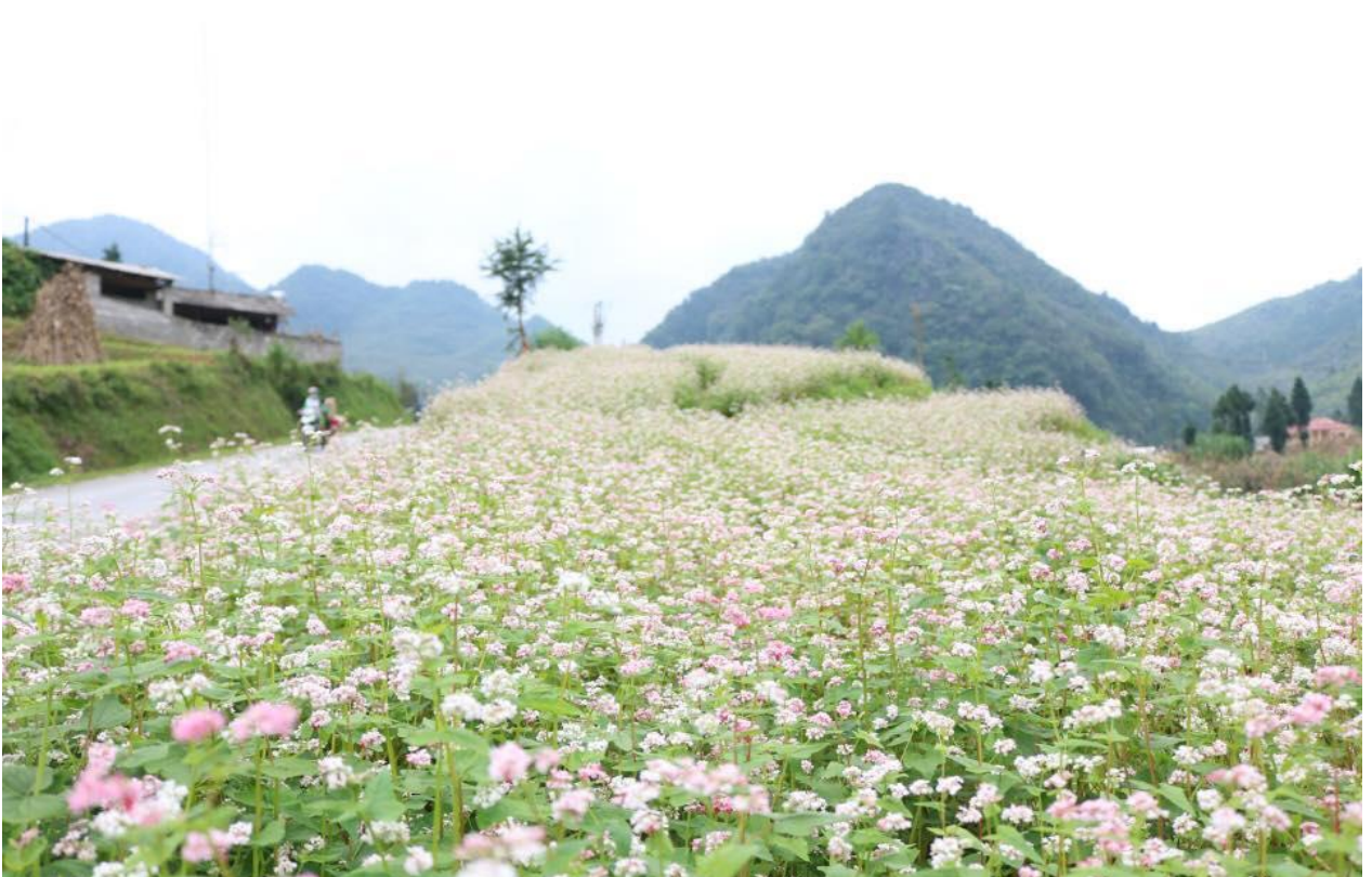
Cánh đồng hoa Tam giác mạch