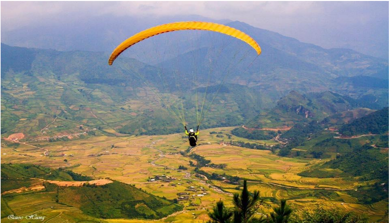
Hoạt động bay dù trên thềm hoa Tam giác mạch