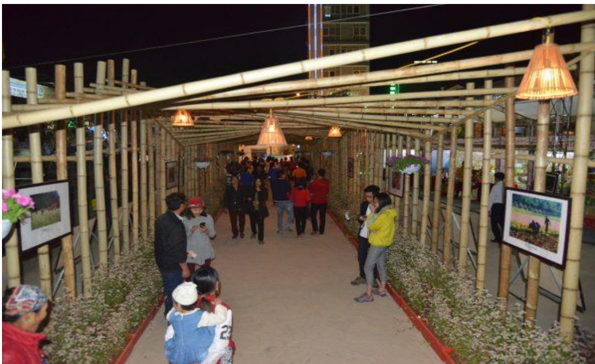
Triển lãm ảnh