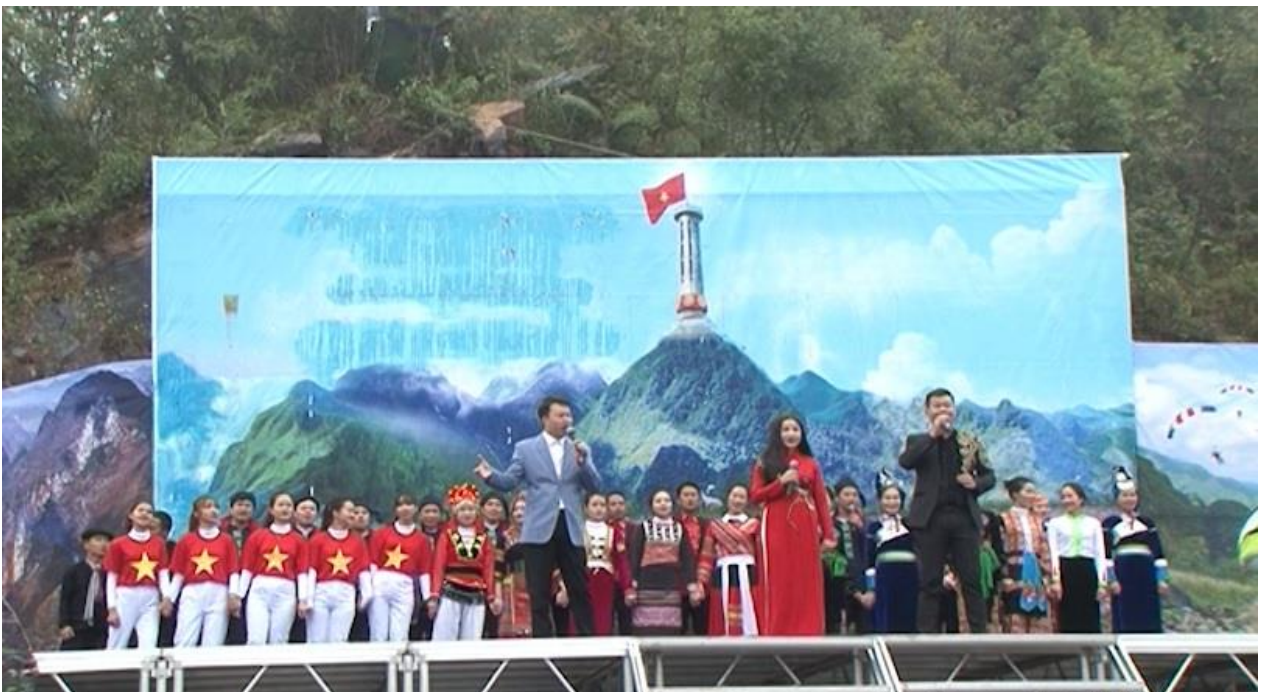
Hòa nhạc dưới chân Cột Cờ Lũng Cú