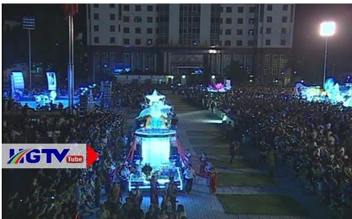
Lễ hội đường phố