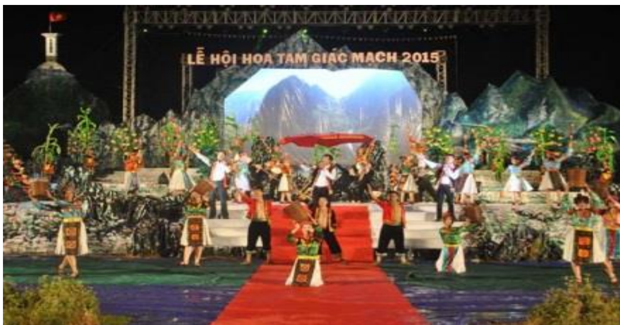
Chương trình khai mạc