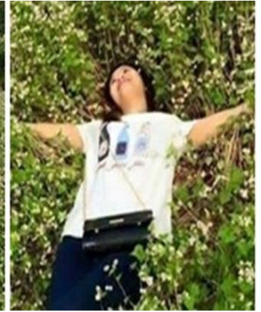
Hoa Tam giác mạch bị khách du lịch giẫm nát