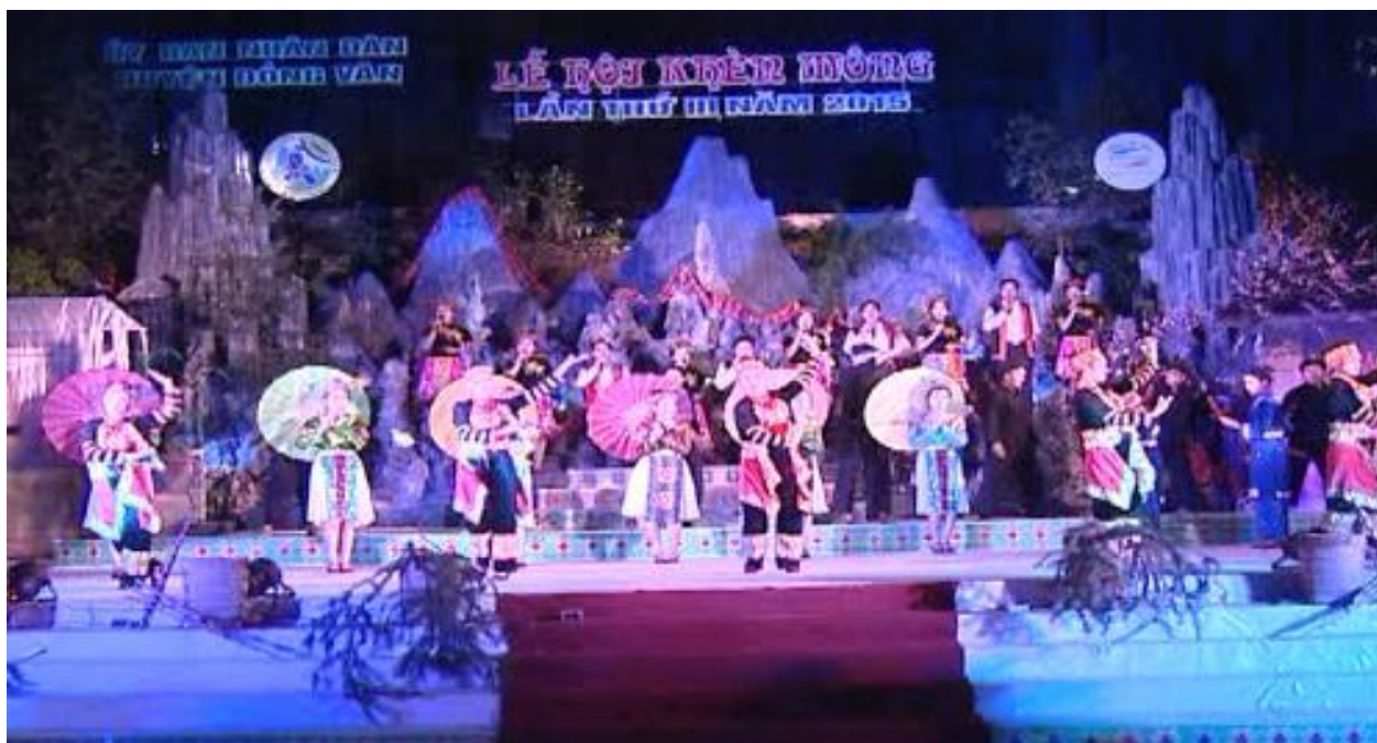
Festival Khèn Mông