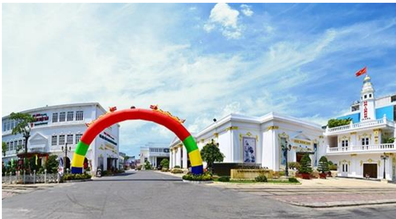
Toàn cảnh Hải Đăng Plaza