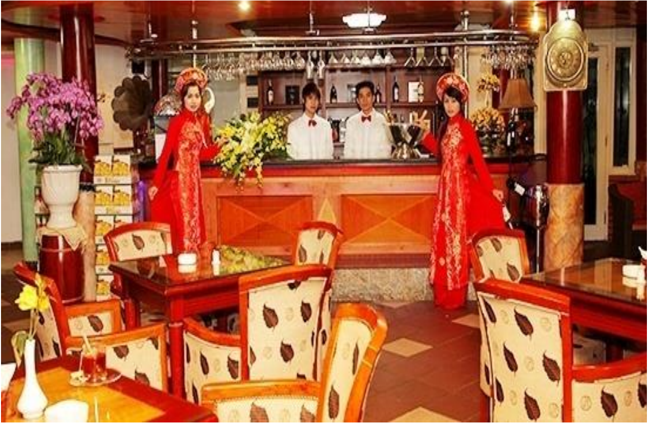
Nhà hàng – Bar