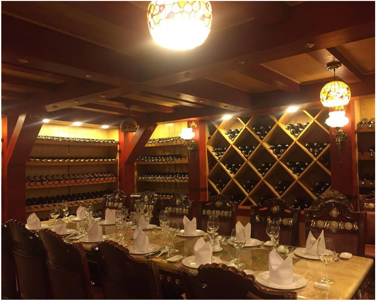
Hầm bia, hầm rượu Hải Đăng Plaza