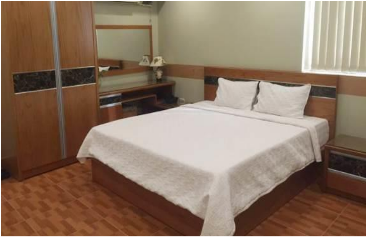
Phòng ngủ khách sạn Hải Đăng Plaza