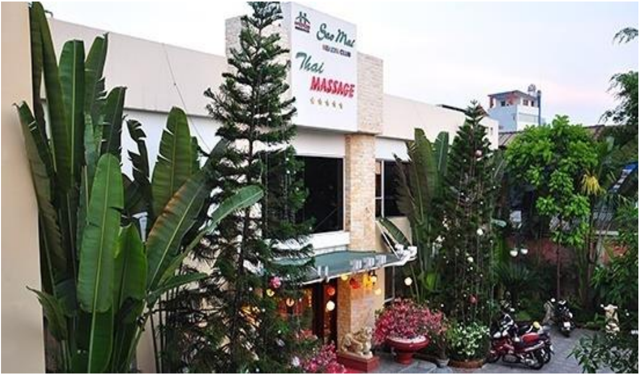
Trung tâm luyện tập thể thao và chăm sóc sức khỏe Sao Mai