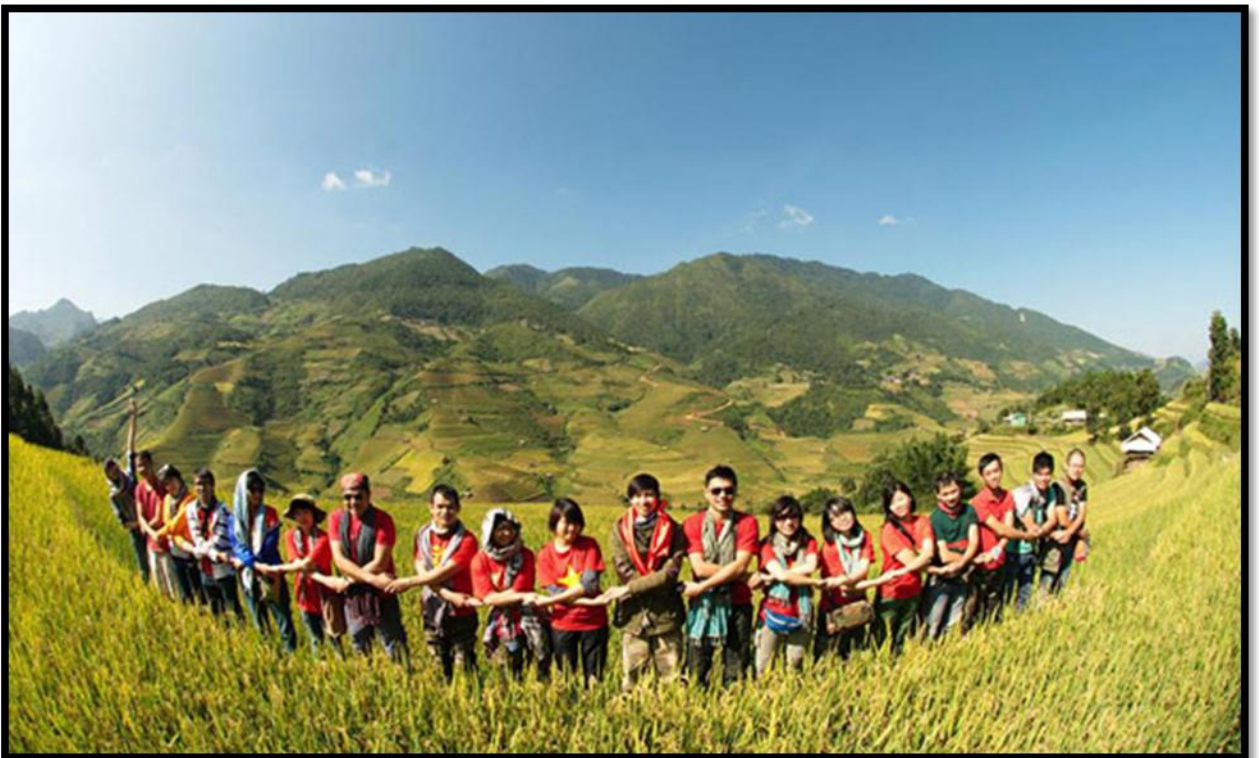
Hình 06. Chinh phục - Khám phá - Đoàn kết - Yêu thương