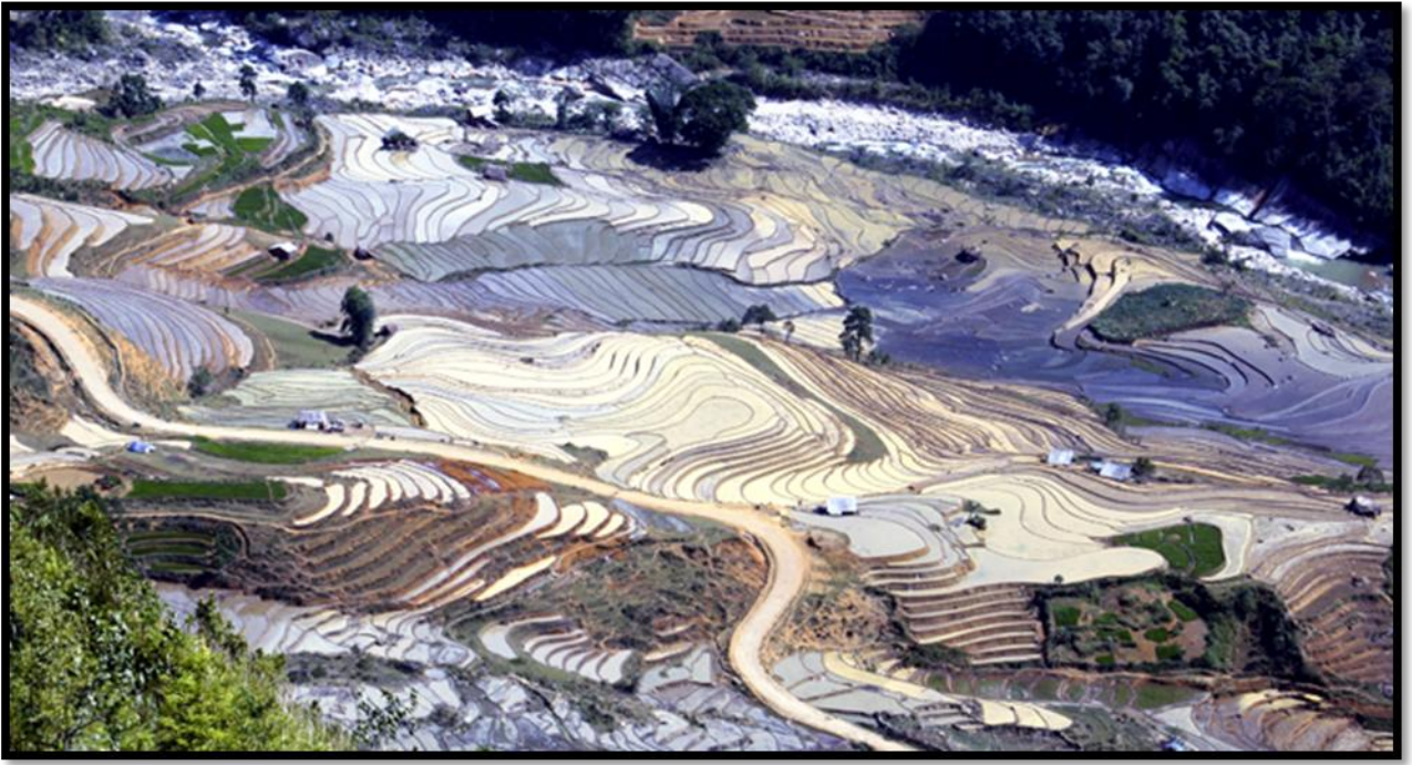
Hình 03. Vẻ đẹp ruộng bậc thang ở Y Tý - Lào Cai