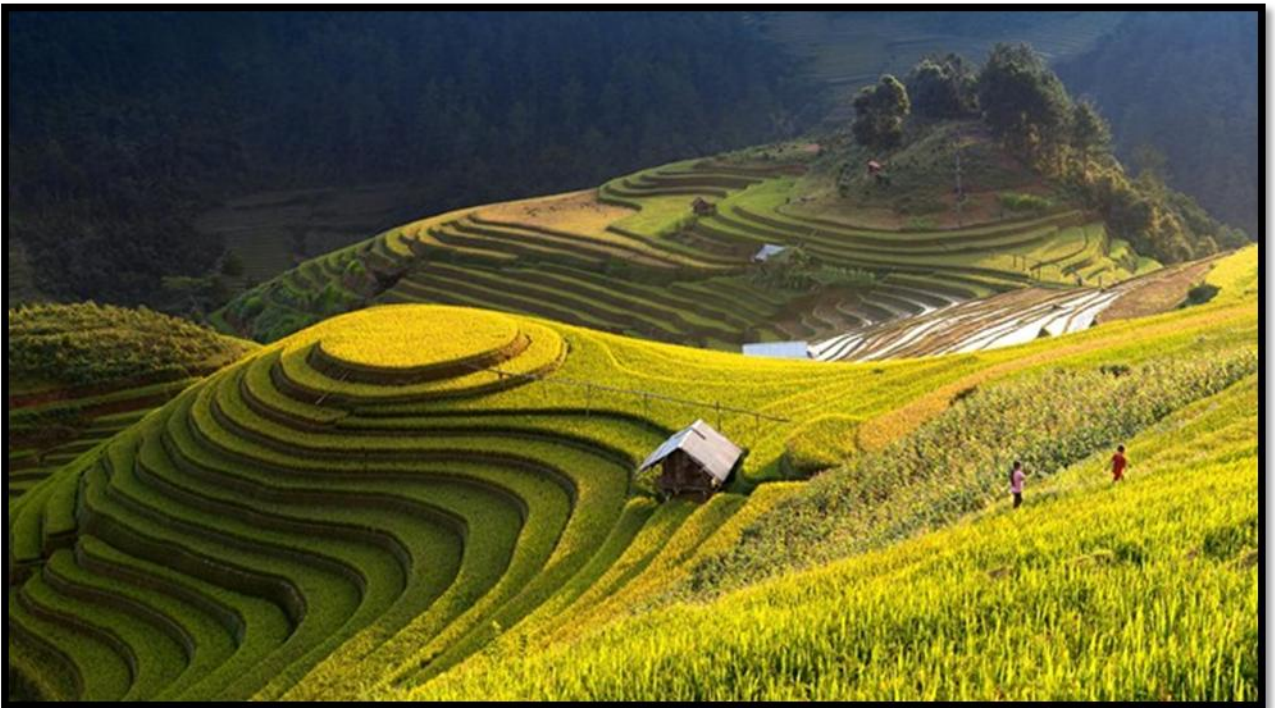
Hình 04. Mùa Càng Chải mùa lúa chín