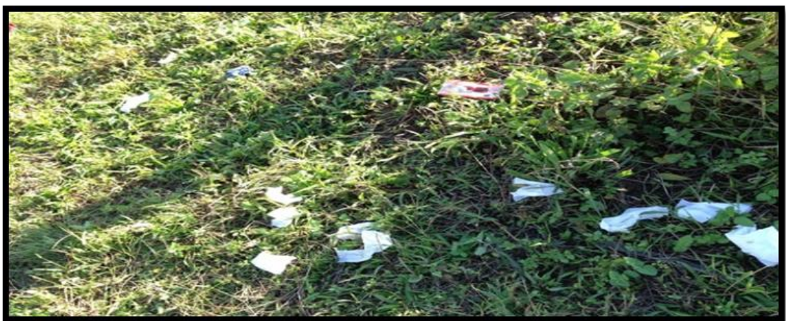
Hình 08. Và để lại rác trên những đồi chè...