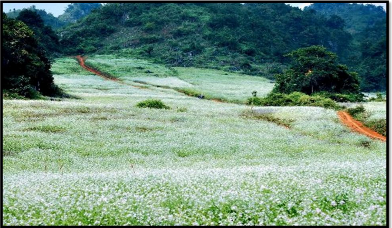
Hình 05. Mùa hoa cải trắng Mộc Châu