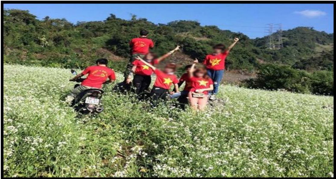
Hình 07. Chạy xe thẳng vào cánh đồng hoa