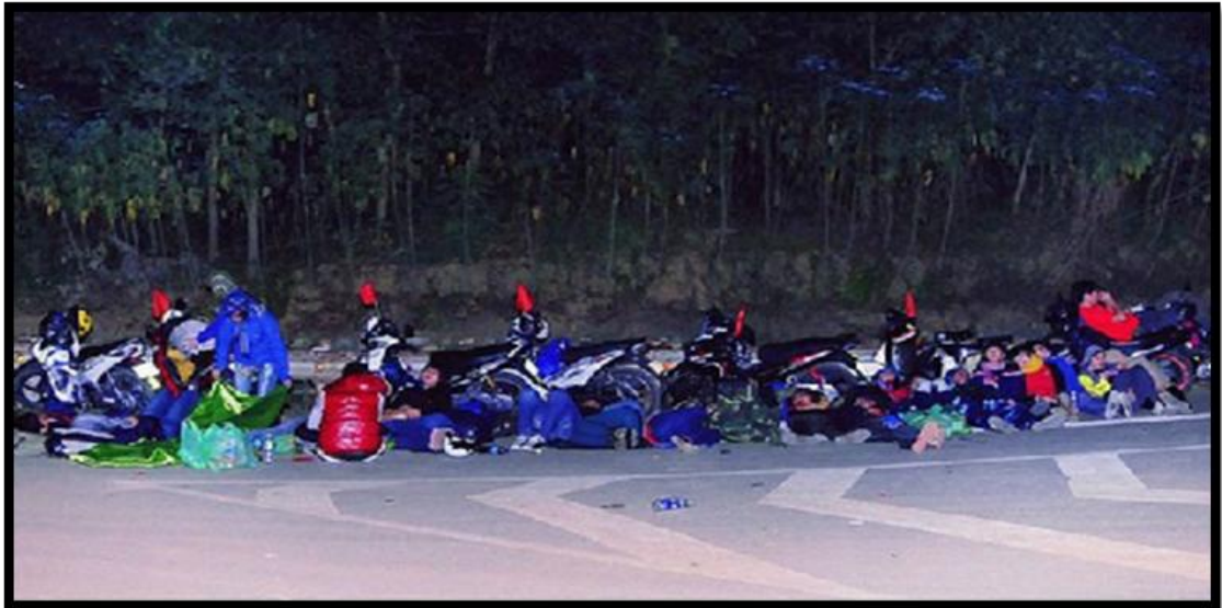
Hình 07. Bức ảnh dậy sóng cộng đồng khi 50 phút thủ nằm ngủ bên lề đường tại một cung đường hẹp