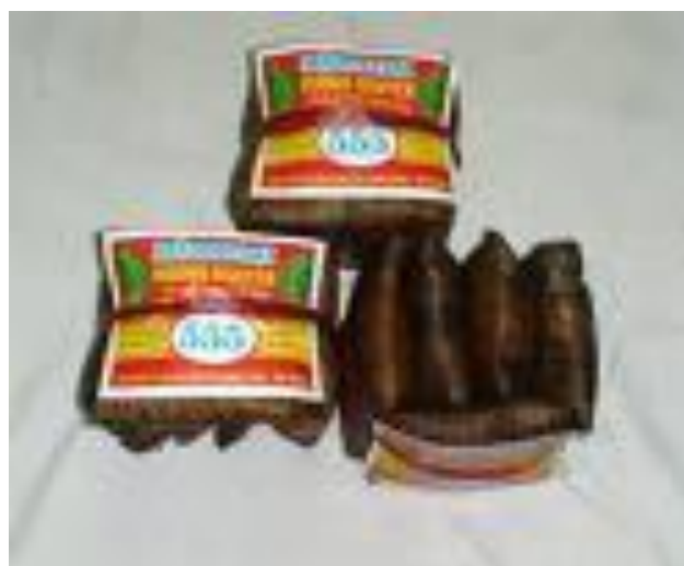
Đặc sản bánh gai Ninh Giang.