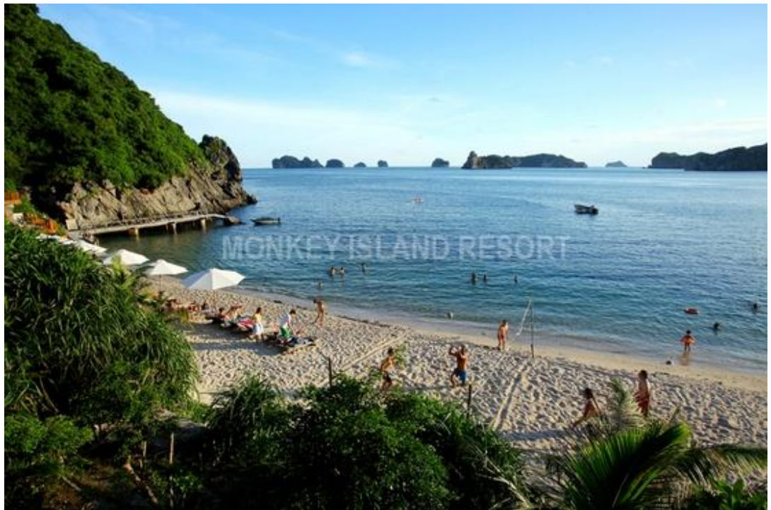
Hình 4: Bãi biển Đảo Khi - Cát Bà