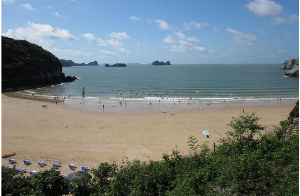
Hình 1: Bãi biển Cát Cò 1 - Cát Bà