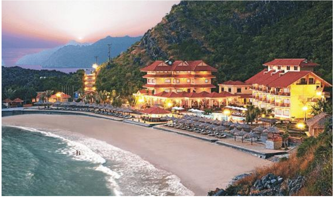
Hình 3: Bãi biển Cát Cò 3 - Cát Bà