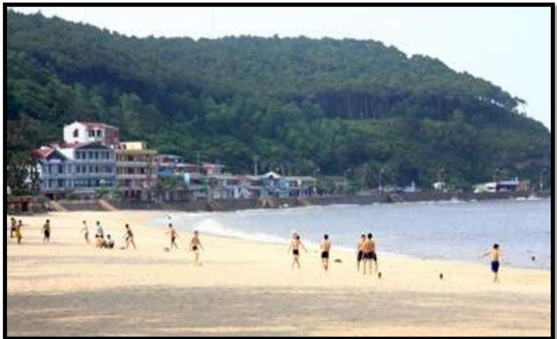
Hình 6: Bãi biển Khu 2 - Đồ Sơn