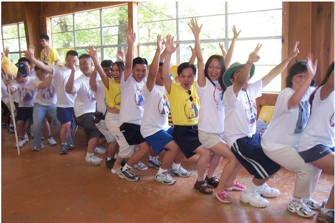
Hình 10: Team building indoor