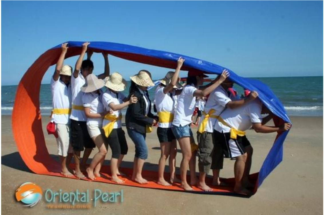
Hình 9: Bánh xe thể kỷ