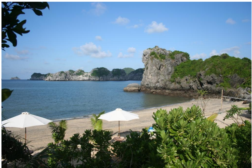
Hình 2: Bãi biển Cát Cò 2 - Cát Bà