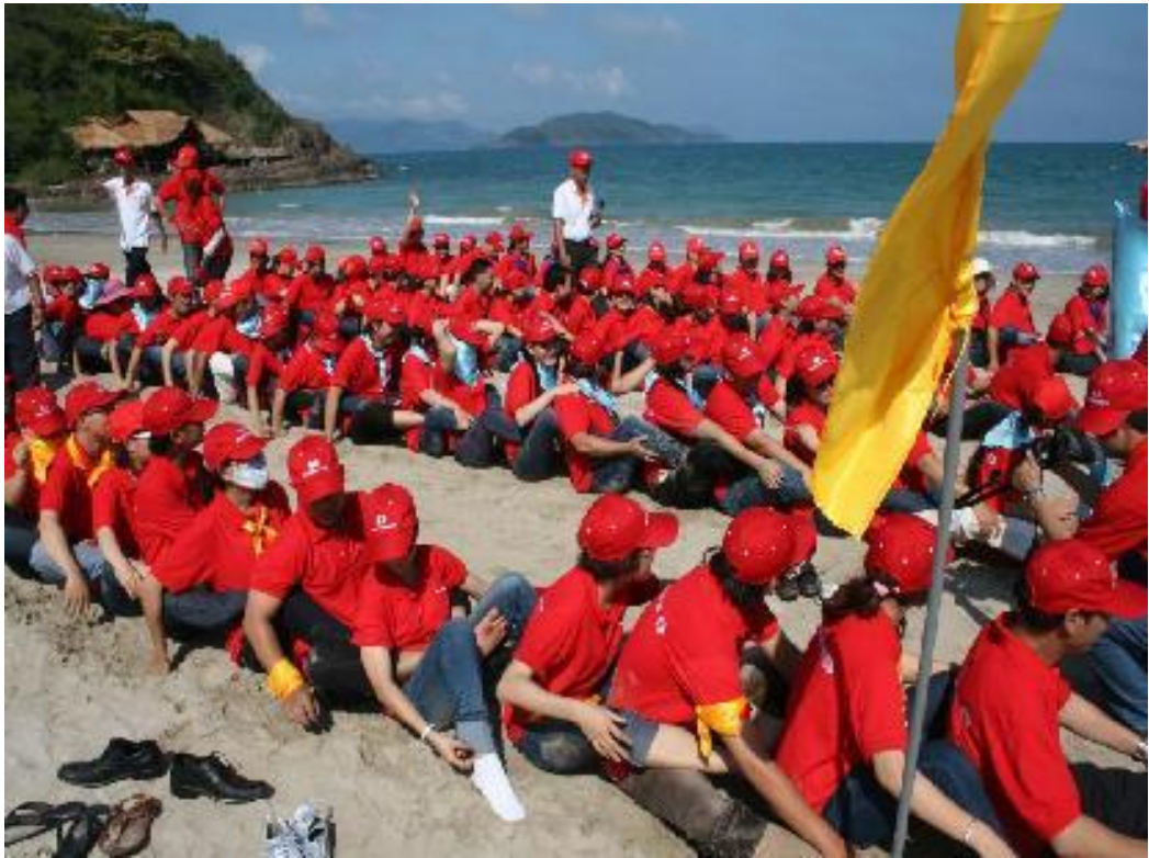
Hình 7: Đua ghe ngo trên cạn