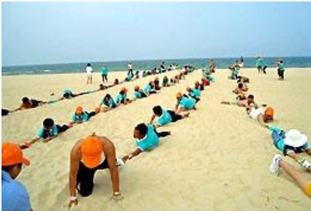
Hình 8: Xếp đội hình dài nhất