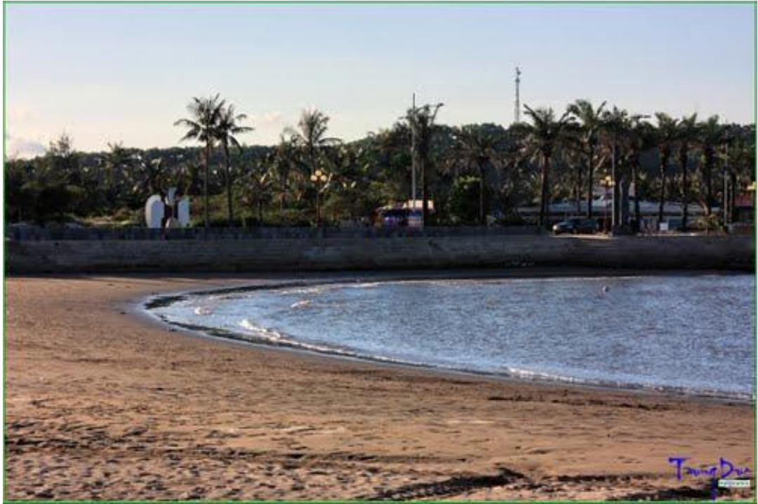
Hình 5: Bãi biển tại Hòn Dấu Resort - Đồ Sơn