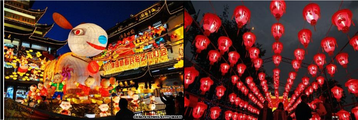
Lễ hội đèn lồng ở Thượng Hải