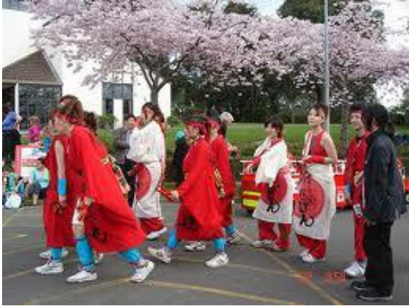
Lễ hội hoa anh đào Nhật