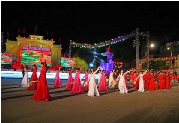
Lễ hội hoa phượng đỏ - Hải Phòng lần 1