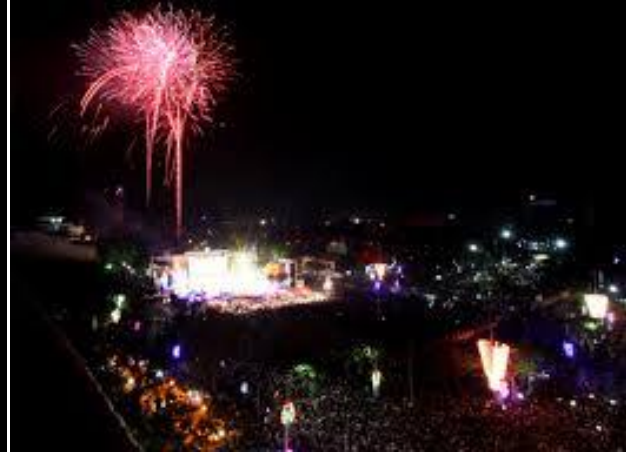
Lễ hội hoa phượng đỏ lần 2