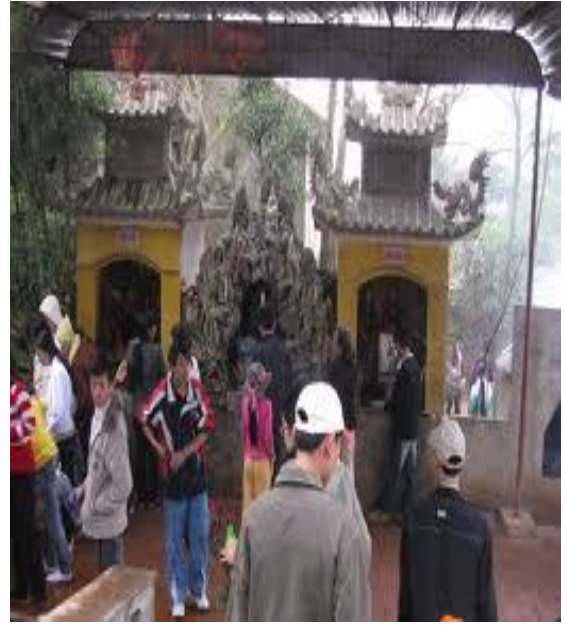
Lầu cô, lầu cậu