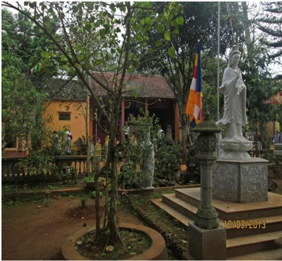
Chùa Bích Vân (Am Tiên tự)