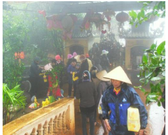
Xin nước ở giếng Tiên