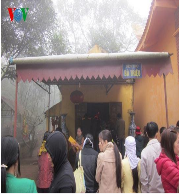
Đền thờ Bà Triệu