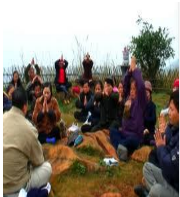
Huyết khí thiêng