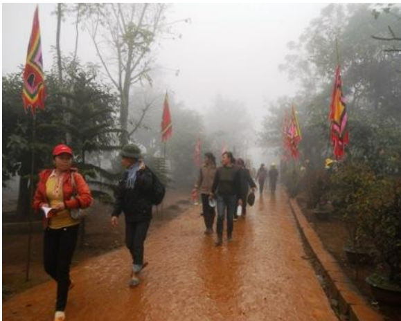
Khách hành hương lên Am Tiên