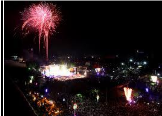
Lễ hội hoa phượng đỏ lần 2