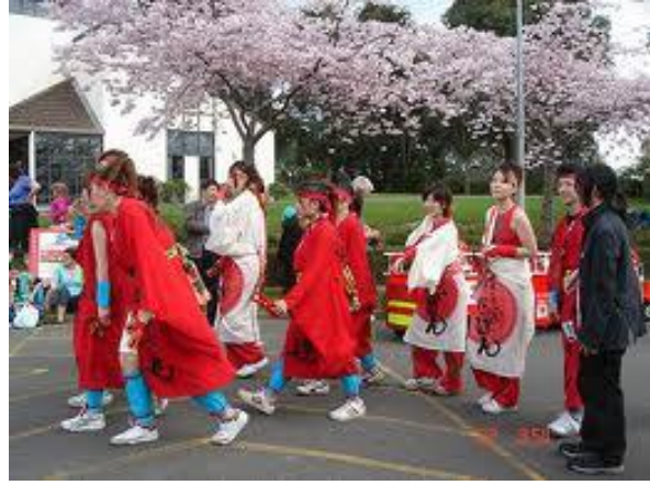
Lễ hội hoa anh đào Nhật