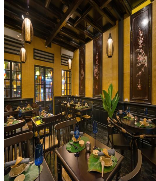
Nhà hàng tại đảo Tuần Châu