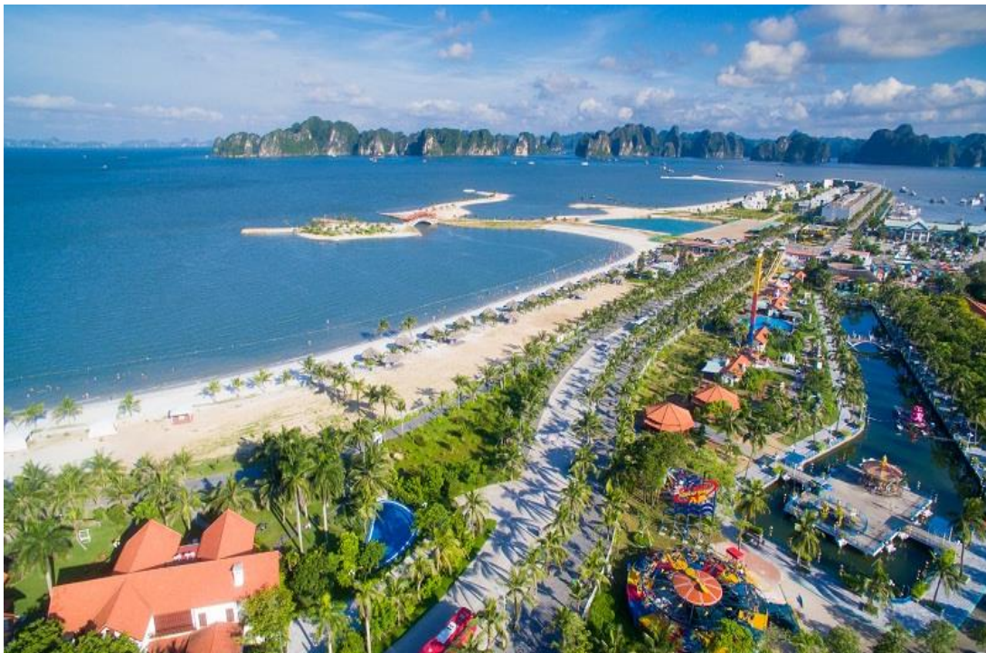
Bãi tắm nhân tạo tại đảo Tuần Châu