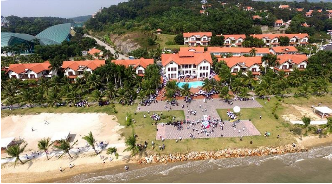
Khu biệt thự nghỉ dưỡng ven biển