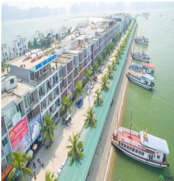
Khách sạn tại Tuần Châu