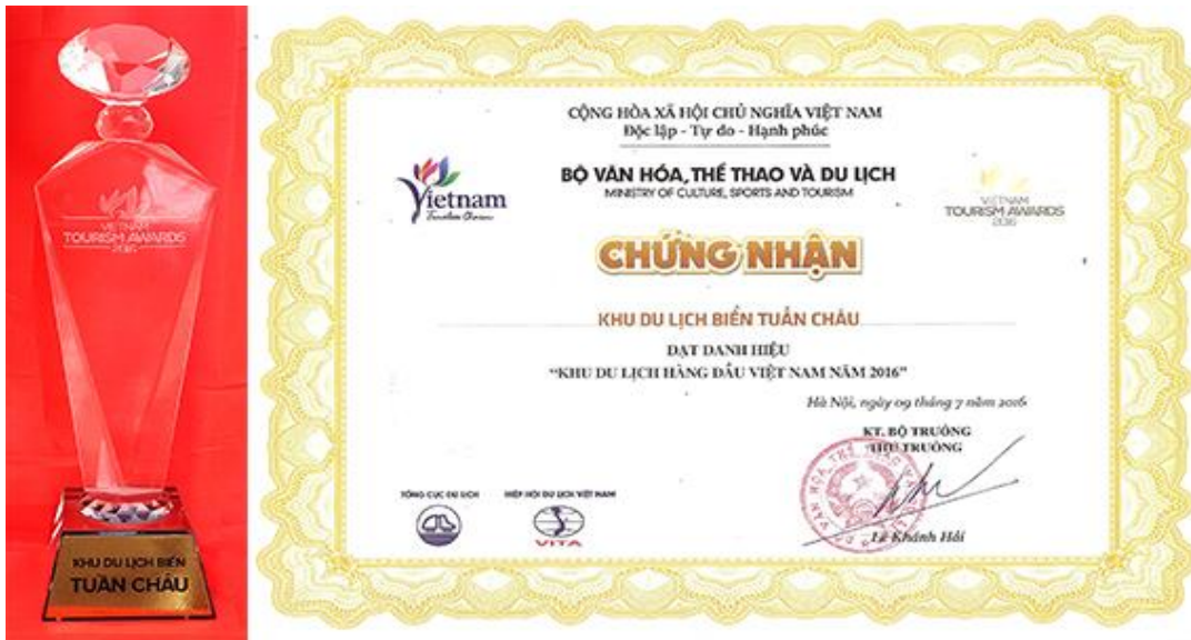
Cúp và giấy chứng nhận khu du lịch hàng đầu Việt Nam