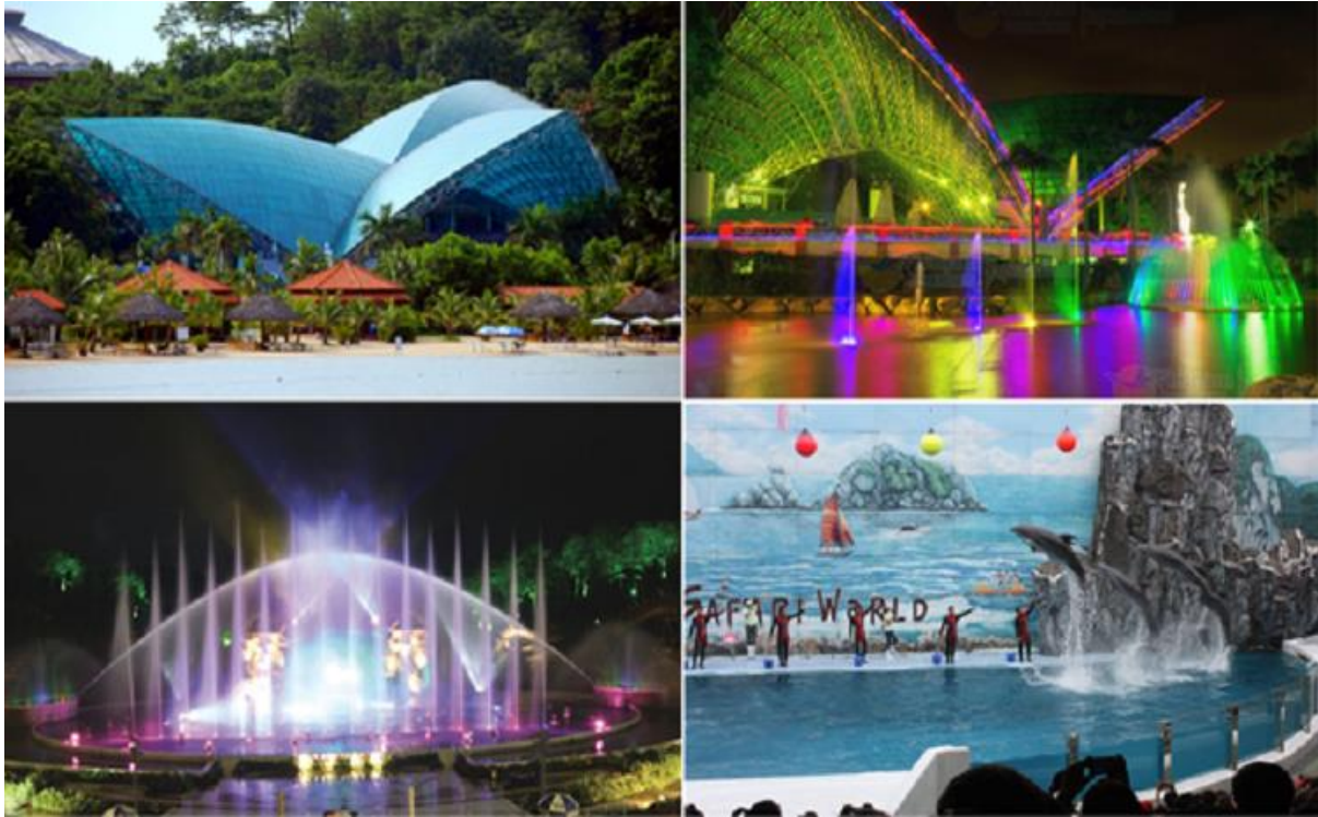
Sân khấu nhạc nước, khu biểu diễn cá heo đảo Tuần Châu