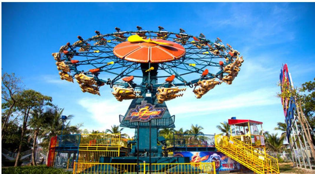
Khu vui chơi ngoài trời