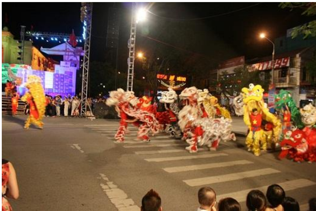
Múa lân trong diễu hành của đoàn Võ Việt Đạo (Vovinam)