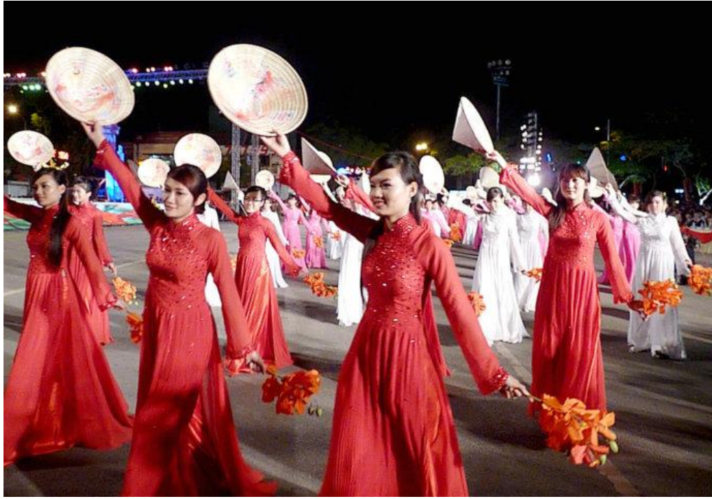
Các nữ tú với chùm hoa phượng đỏ thắm trên tay