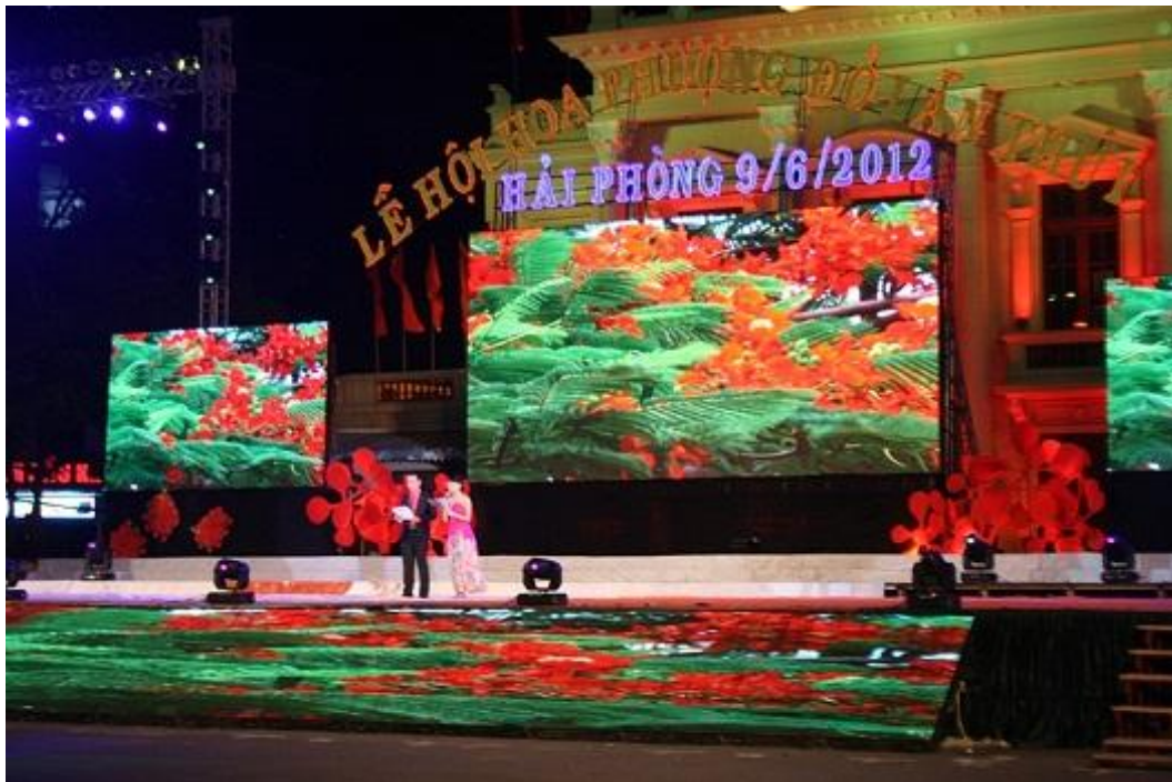
Sân khấu hoành tráng rực màu phượng thắm