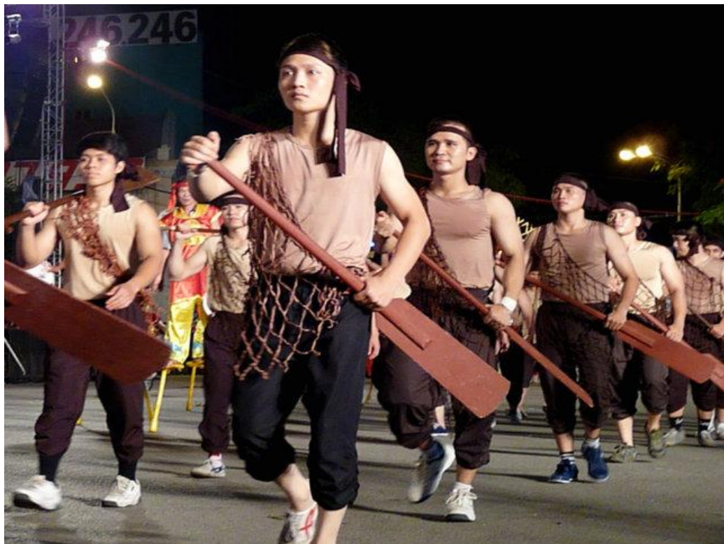
Các nam thanh của làng chài