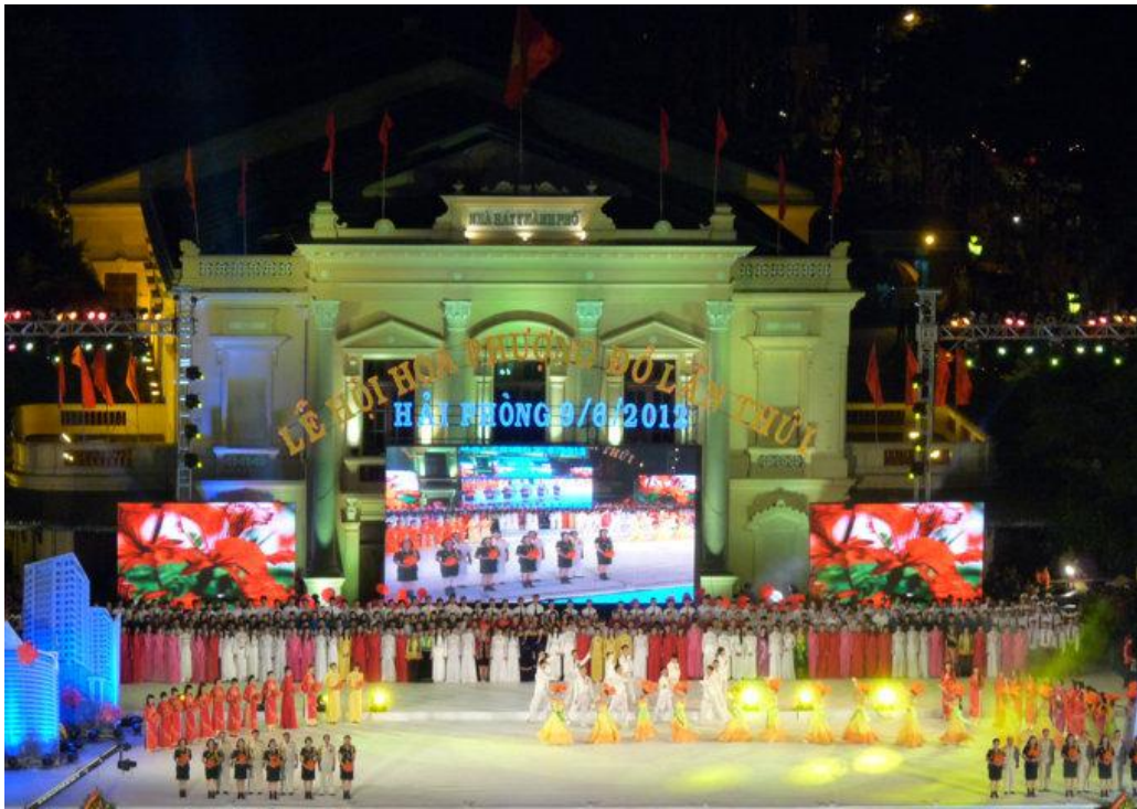
Dàn hợp xướng với 500 nghệ sĩ, diễn viên