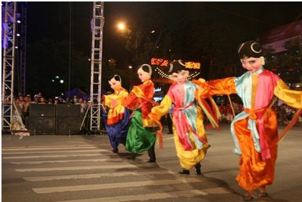
Biểu diễn múa rối thừng của đoàn Múa rối Hải Phòng