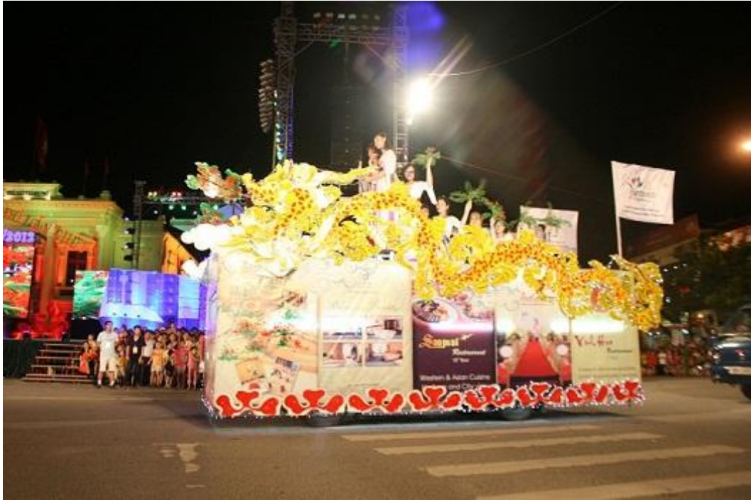
Xe mô hình “Rồng đang vươn mình ra biển”