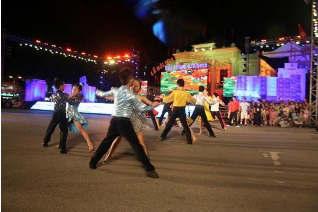
Màn thể hiện của Đoàn Dance sport