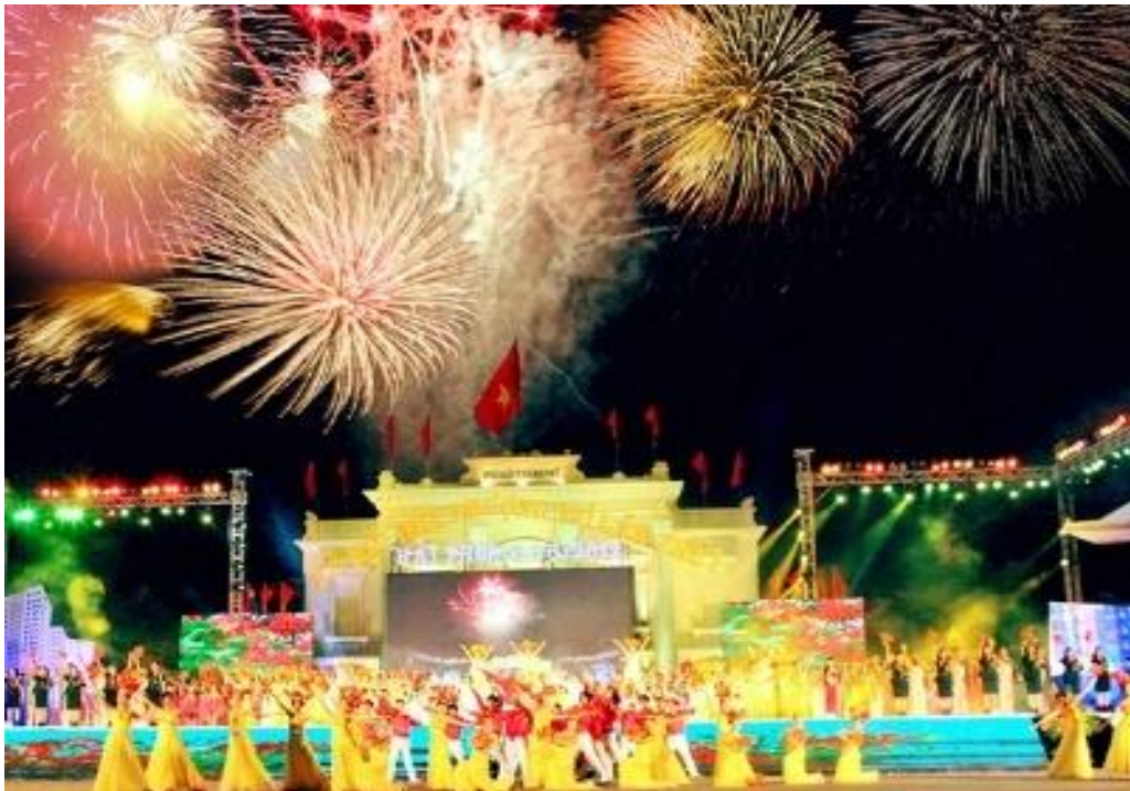
Màn bắn pháo hoa