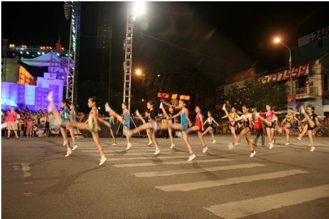
Đoàn biểu diễn Aerobic của các vận động viên “nhí”