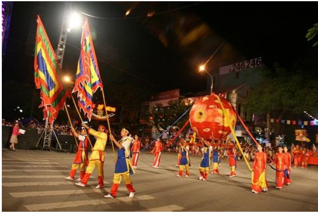
Hội “vật cầu rước Ông lộn” - Kim Sơn (Tân Trào - Kiên Thụy)