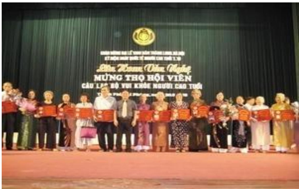
Câu lạc bộ Vui khỏe người cao tuổi.