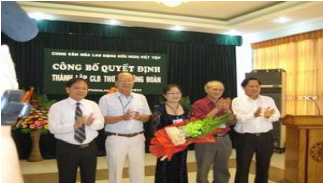
Câu lạc bộ Thơ ca công đoàn.