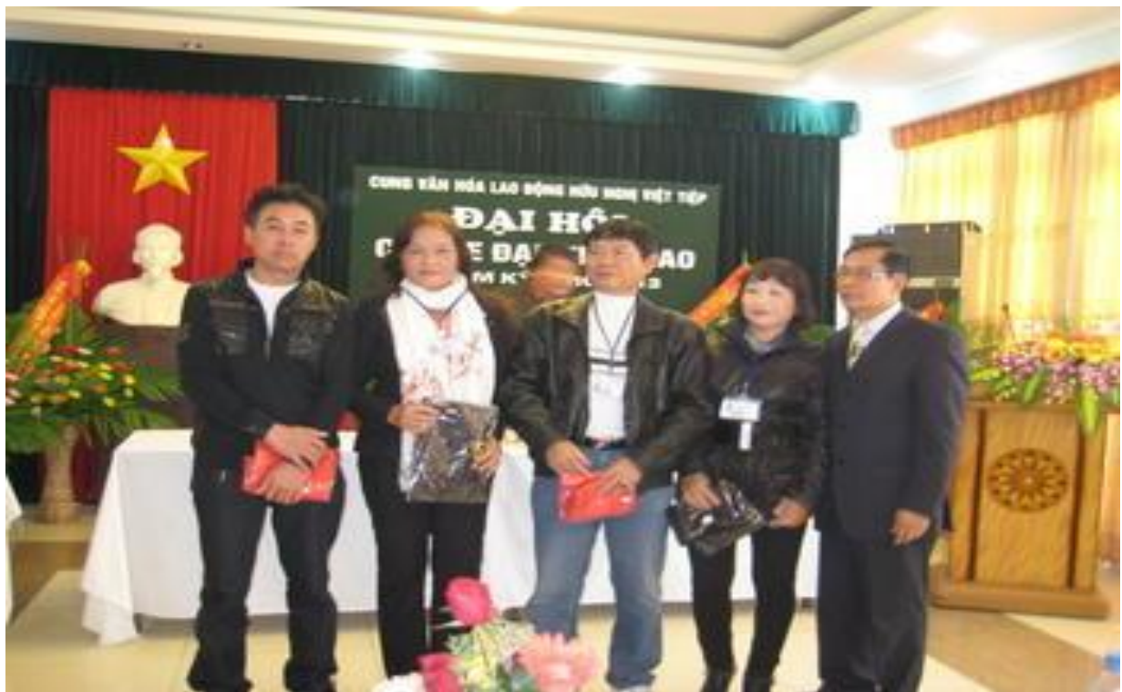
Đại hội câu lạc bộ Xe đạp thể thao.