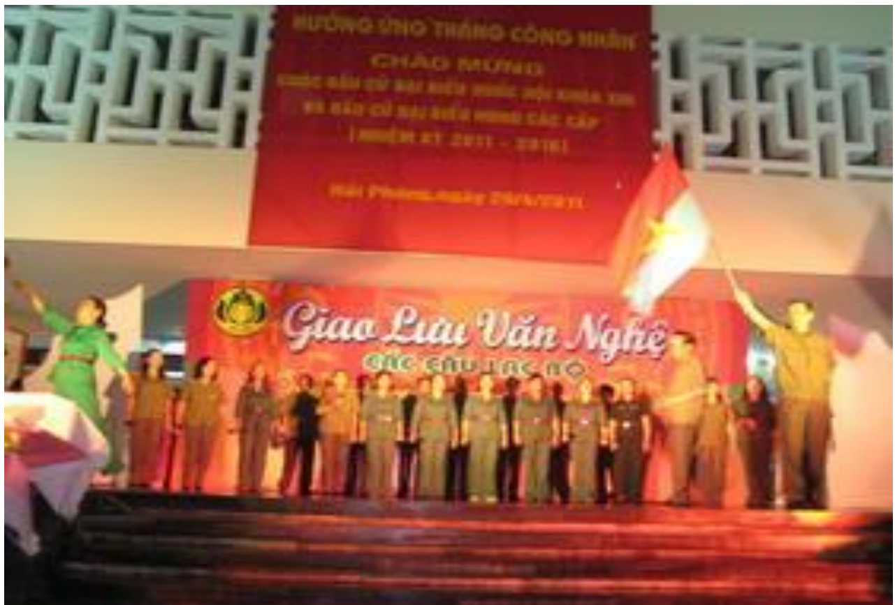
Giao lưu Văn nghệ các câu lạc bộ.

Hình ảnh một số hoạt động và câu lạc bộ ở Cung văn hóa lao động hữu nghị Việt Tiệp.