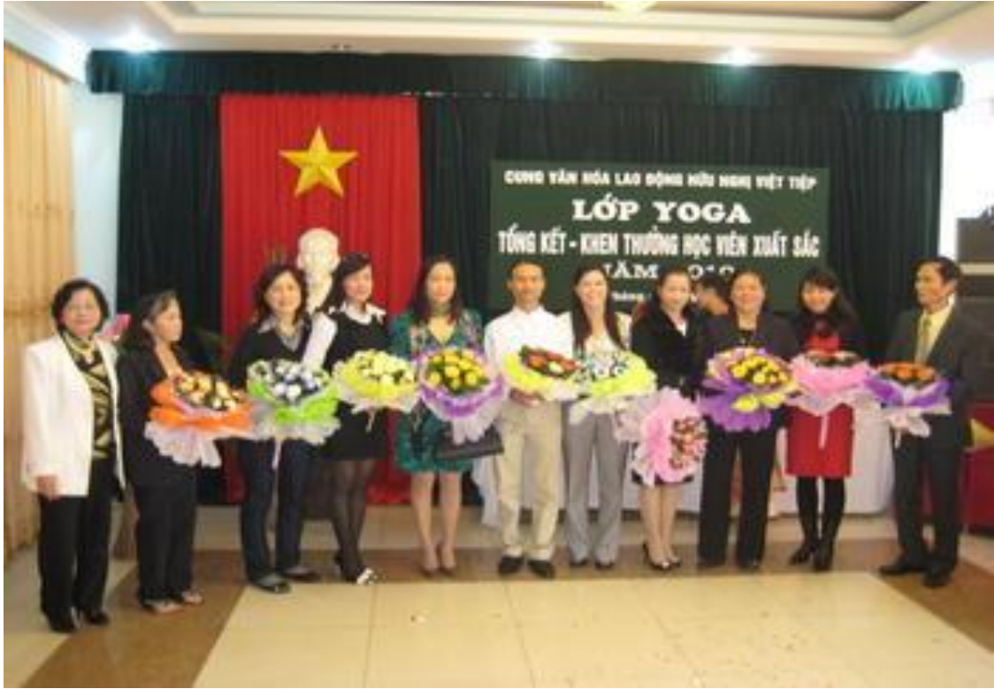
Câu lạc bộ Yoga.