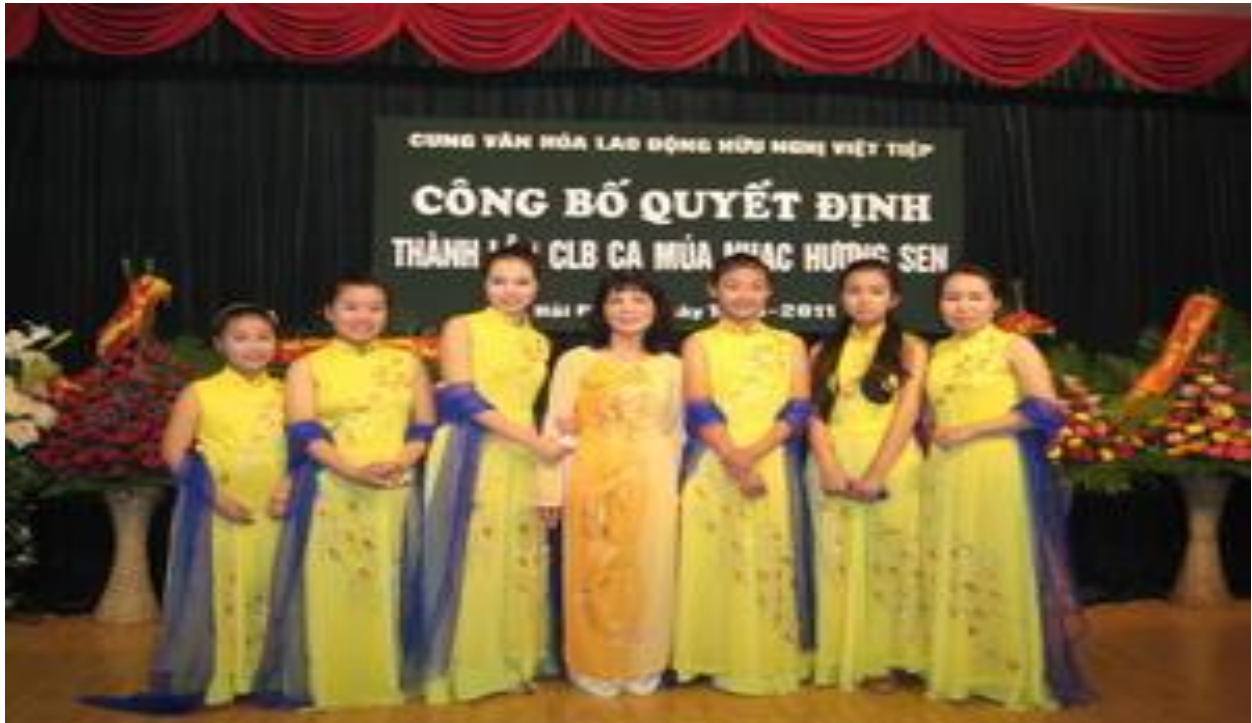
Câu lạc bộ Múa.