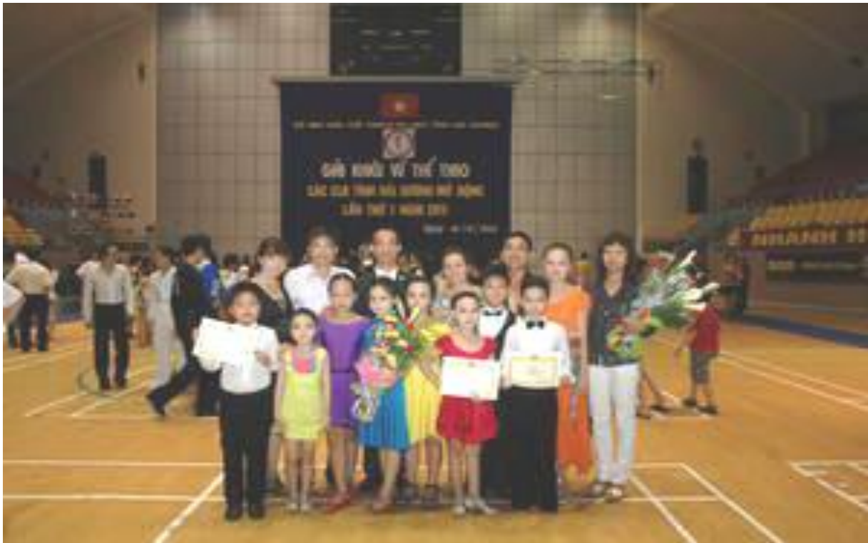
Câu lạc bộ Khiêu vũ thể thao.