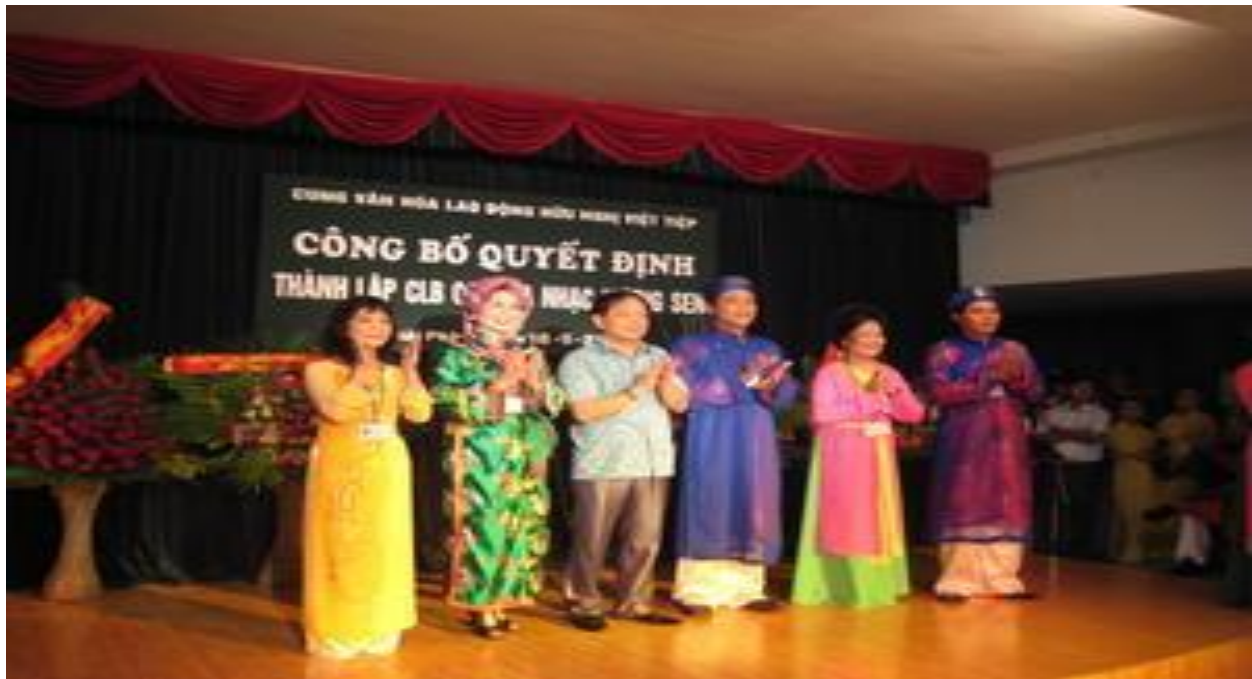
Câu lạc bộ Múa dân tộc.