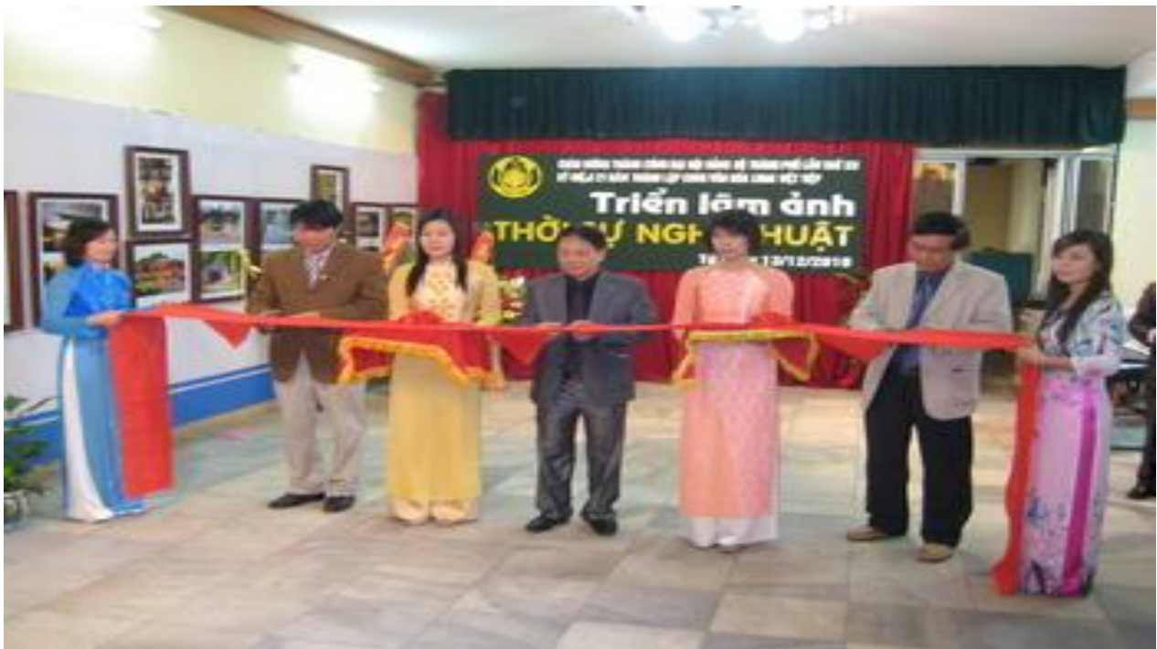
Câu lạc bộ Nhiếp ảnh.