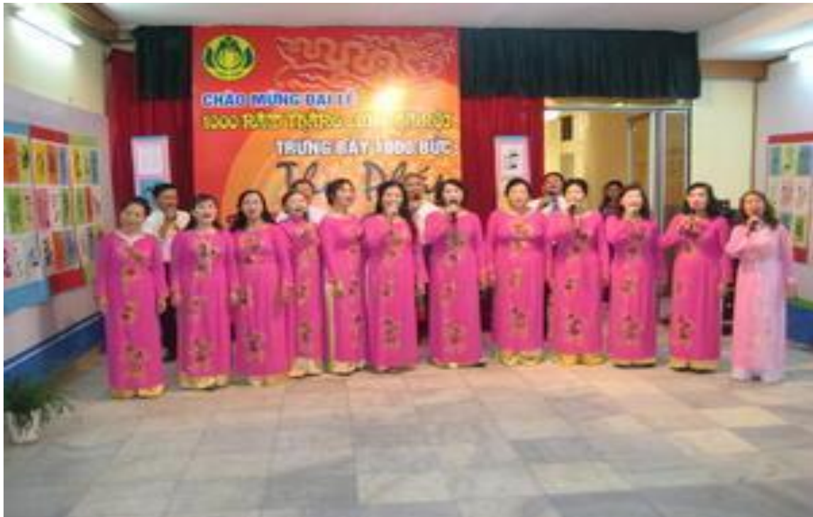
Câu lạc bộ Thư pháp.