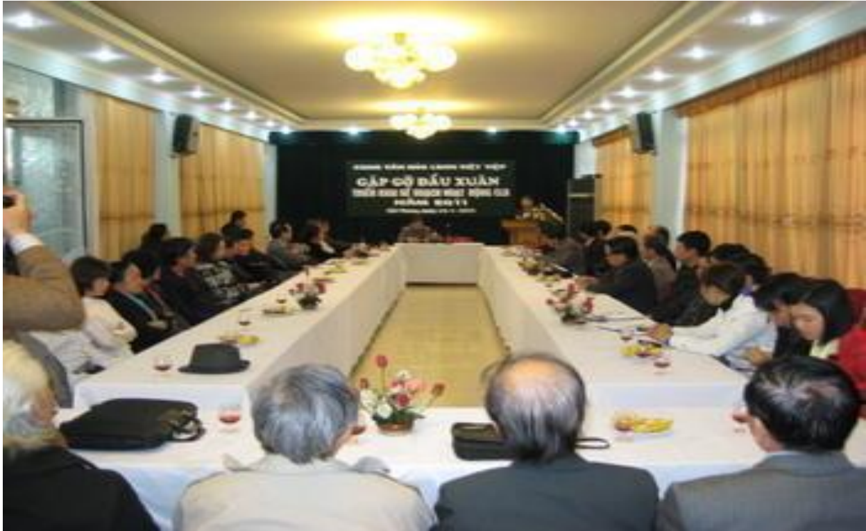
Gặp gỡ đầu xuân cán bộ công nhân viên Cung văn hóa.