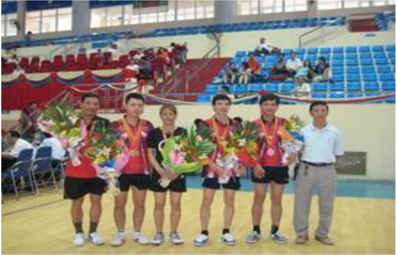
Câu lạc bộ Bóng bàn.