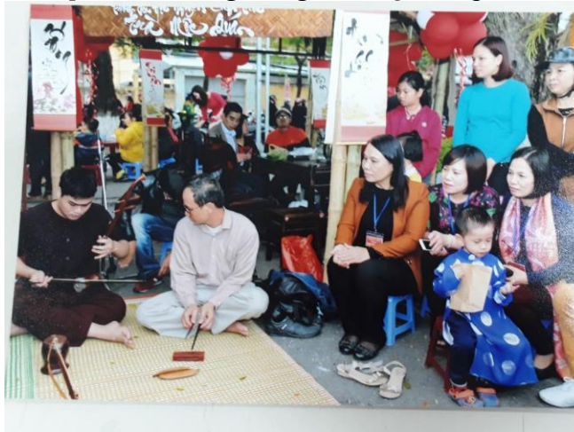
Ảnh: Biểu diễn hát xẩm trong lễ hội