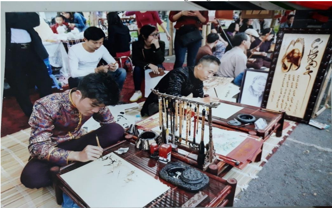
Ảnh: Biểu diễn thi pháp trong lễ hội