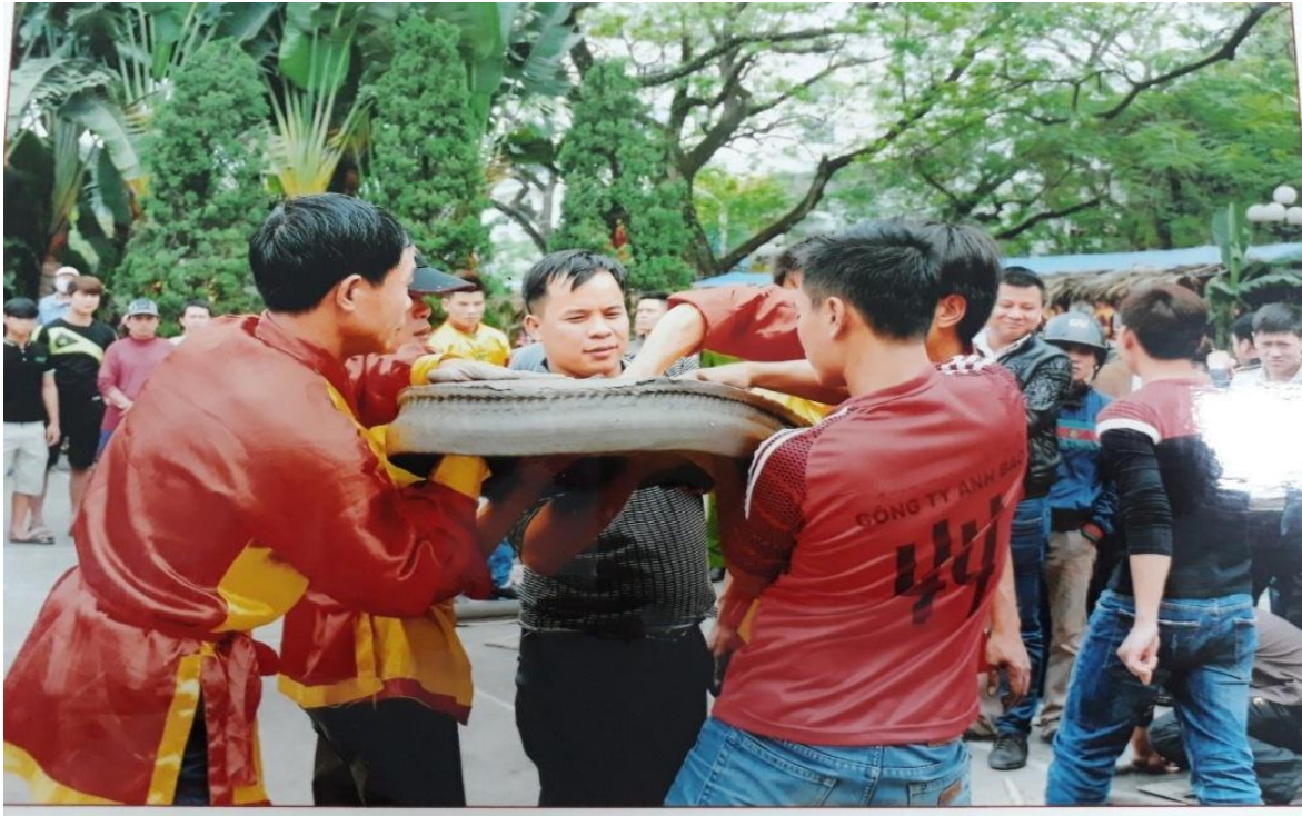
Ảnh: Biểu diễn thi pháo đất trong lễ hội