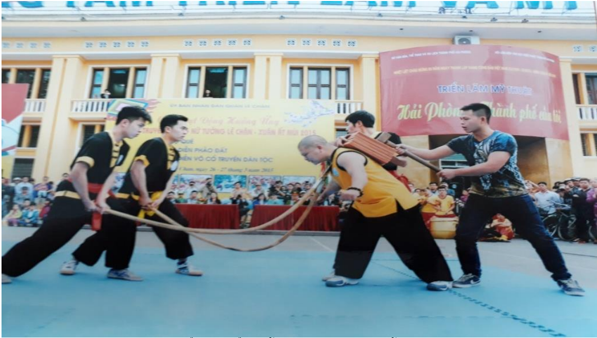
Ảnh: Biểu diễn khí công trong lễ hội