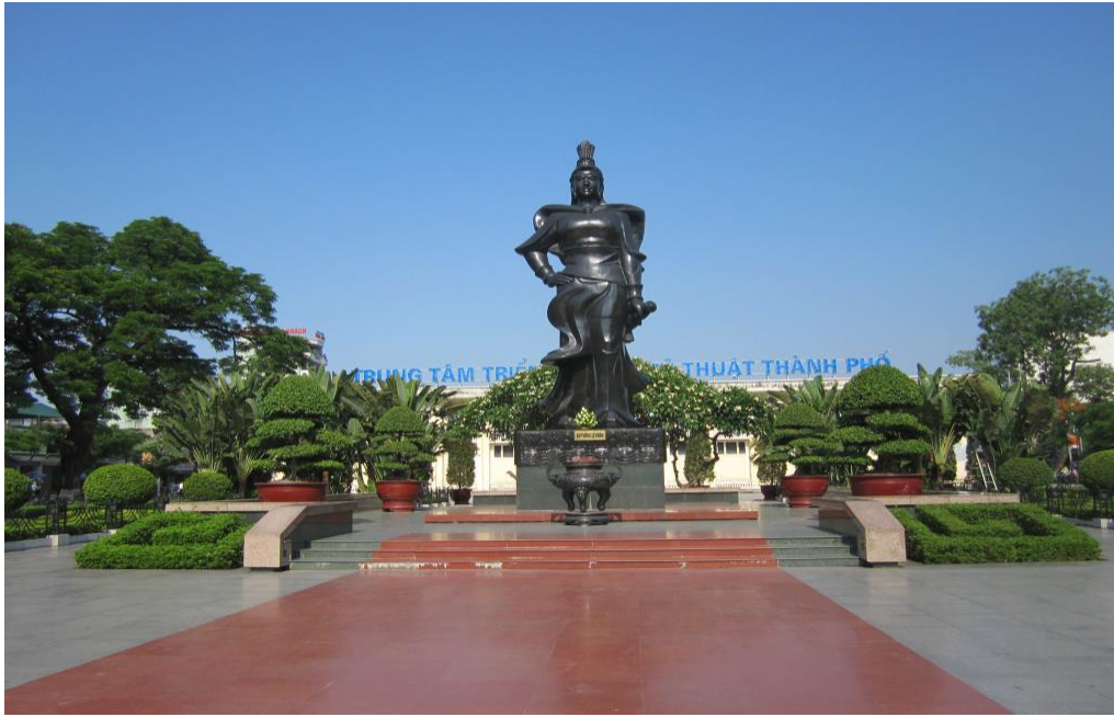
Hình ảnh: Quảng trường tượng đài Nữ tướng Lê Chân.