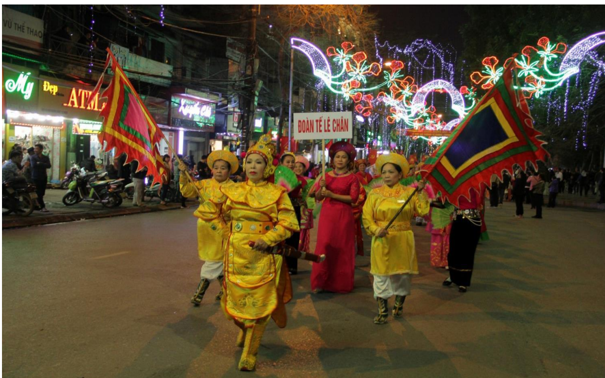
Hình ảnh: Đoàn rước từ Đền Nghè về tượng đài Nữ tướng Lê Chân.