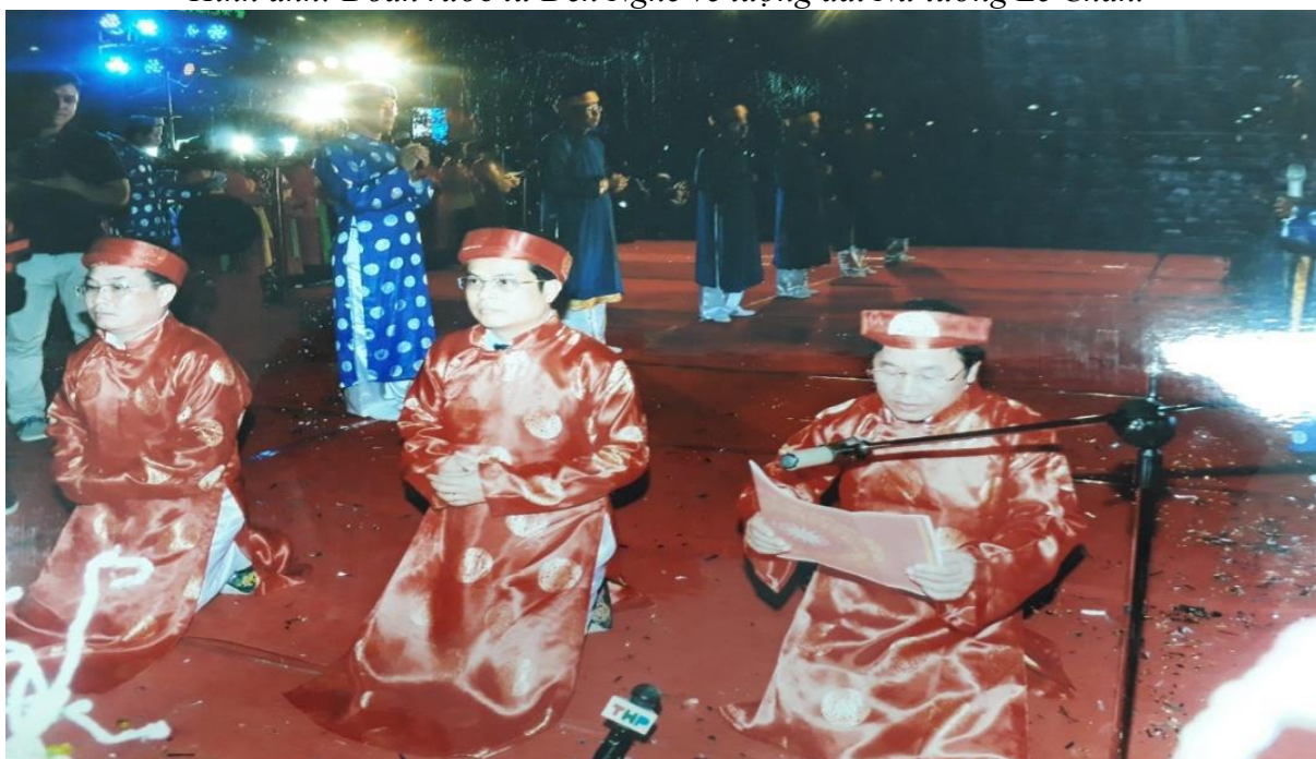
Hình ảnh: Lễ đọc Chúc văn trong Lễ hội