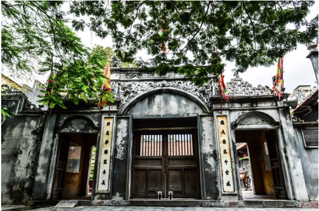
Hình ảnh: Di tích văn hóa - lịch sử Quốc gia Đền Nghè.