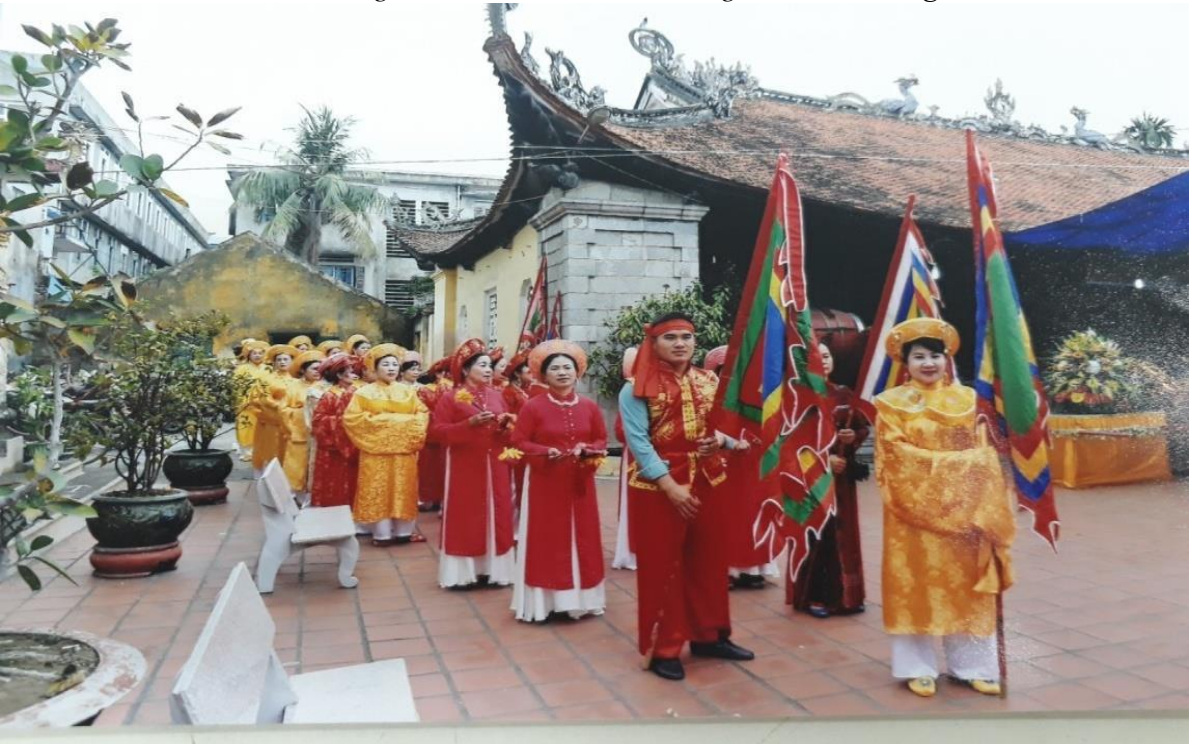
Hình ảnh: Nghi thức rước tại đình An Biên trong lễ hội.