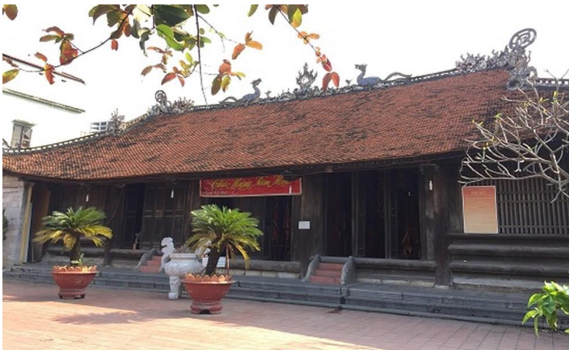
Hình ảnh: Di tích kiến trúc nghệ thuật Quốc gia Đình An Biên.