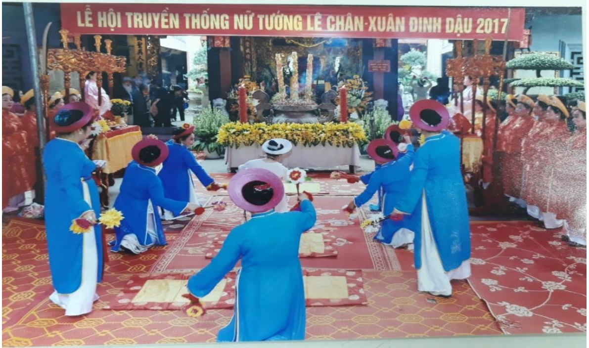
Hình ảnh: Nghi thức mùa sinh tiền trong lễ tế tại đền Nghè.