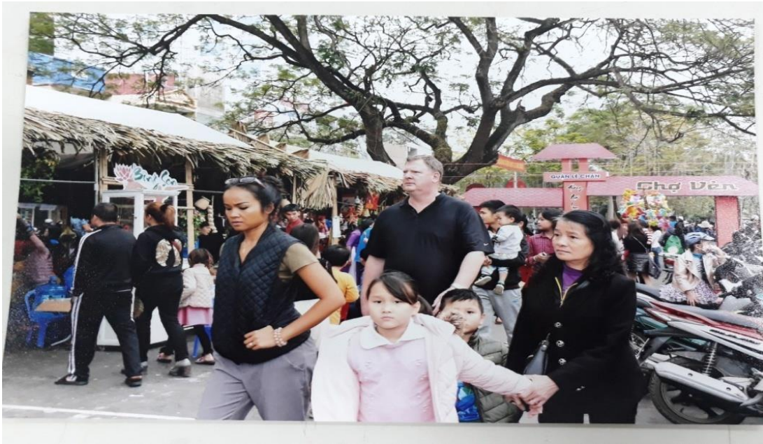
Ảnh: Hình ảnh du khách tham dự Chợ quê của lễ hội