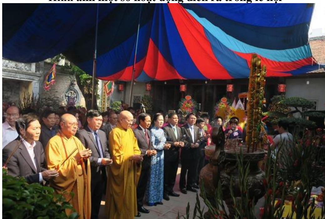
Hình ảnh: Nghi thức dâng hương trong lễ cáo yết tại đền Nghè.