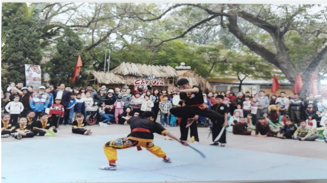
Ảnh: Biểu diễn võ dân tộc trong lễ hội