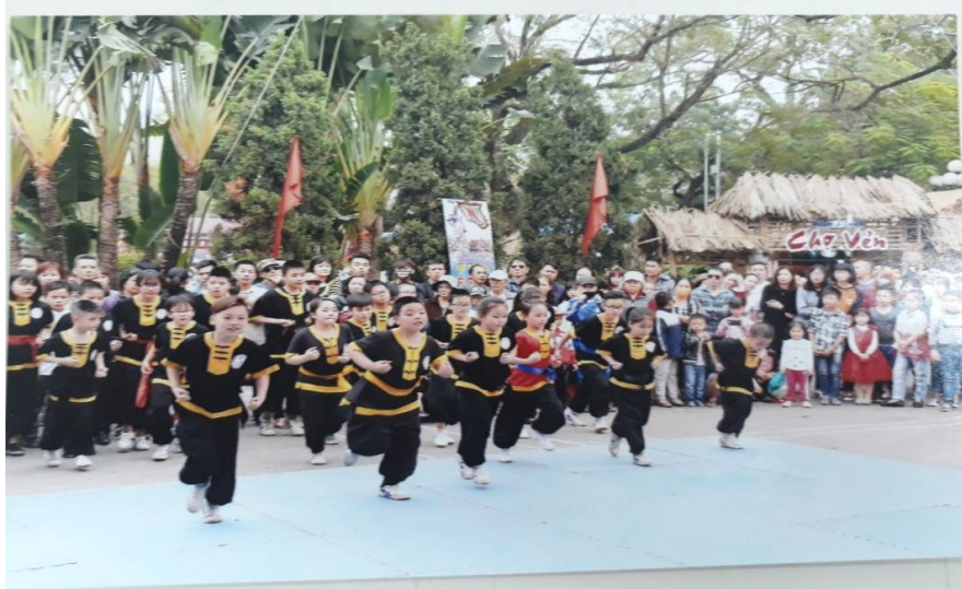
Ảnh: Thiếu nhi biểu diễn võ dân tộc trong lễ hội