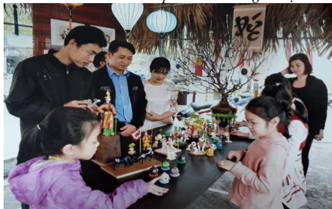
Ảnh: Sản phẩm thủ công mỹ nghệ trong Chợ quê của lễ hội