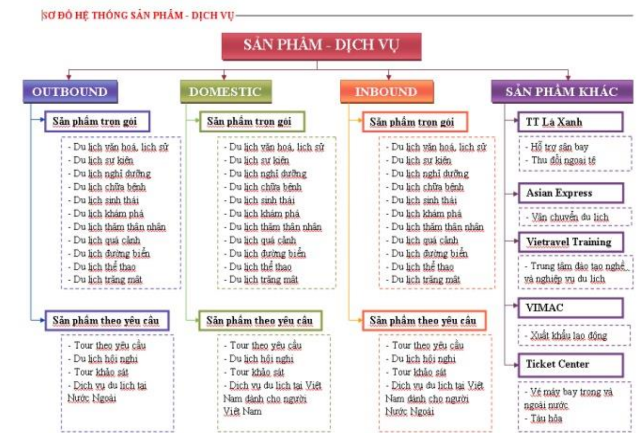
Sơ đồ 2.2. Hệ thống sản phẩm dịch vụ của công ty Vietravel.

Trên đây là hệ thống sản phẩm dịch vụ của tổng công ty cũng như toàn thể các chi nhánh, văn phòng đại diện Vietravel trên cả nước. Và từ đây ta cũng có thể thấy được sự đa dạng về loại hình sản phẩm dịch vụ, đảm bảo phục vụ cho bất kỳ một đối tượng khách nào.