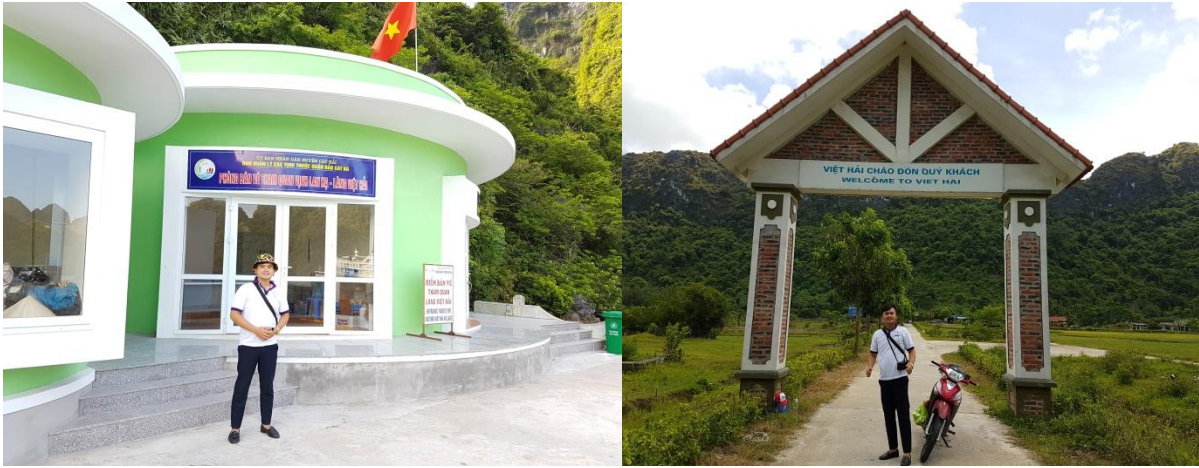
Hình 1: Phương tiện di chuyển và làng chài Việt Hải