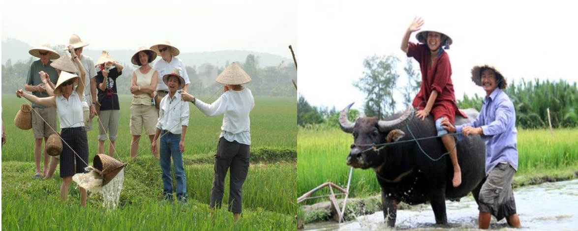
2: Homestay Whisper Nature