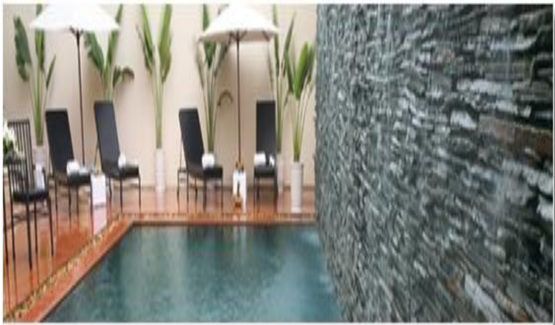
Bể bơi khách sạn Harbourview, Hải Phòng.