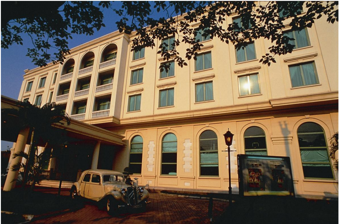
Toàn cảnh khách sạn Harbourview, Hải Phòng.