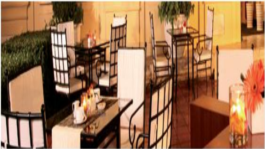
Sân La Terrasse