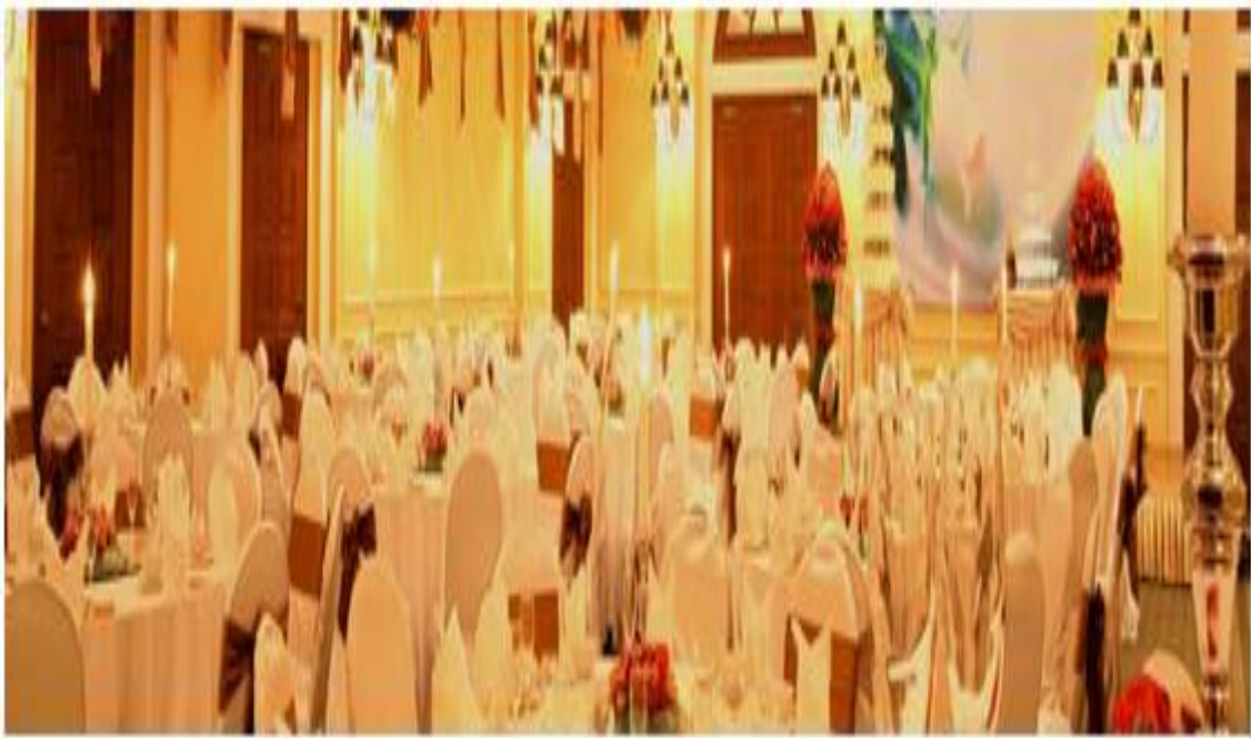
Tiệc c- ới tổ chức tại khách sạn Harbourview, Hải Phòng.