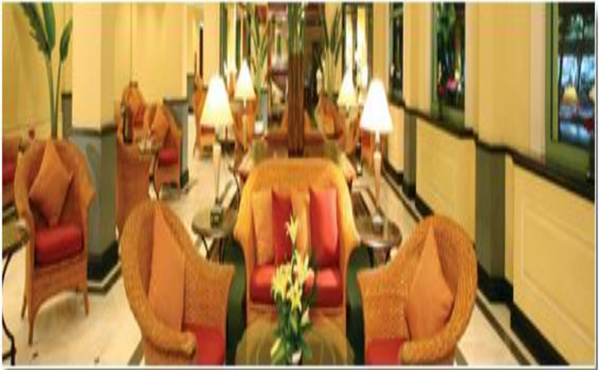
Toàn cảnh đại sảnh khách sạn Harbourview, Hải Phòng.