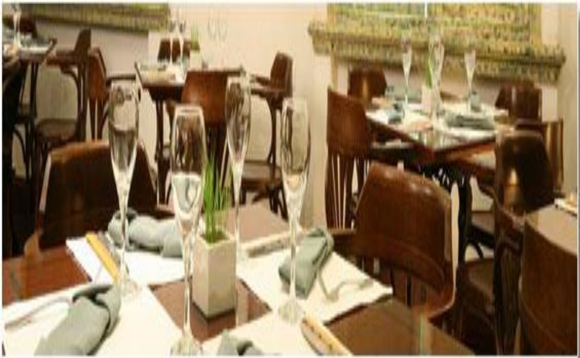
Nhà hàng Nam Ph-ong