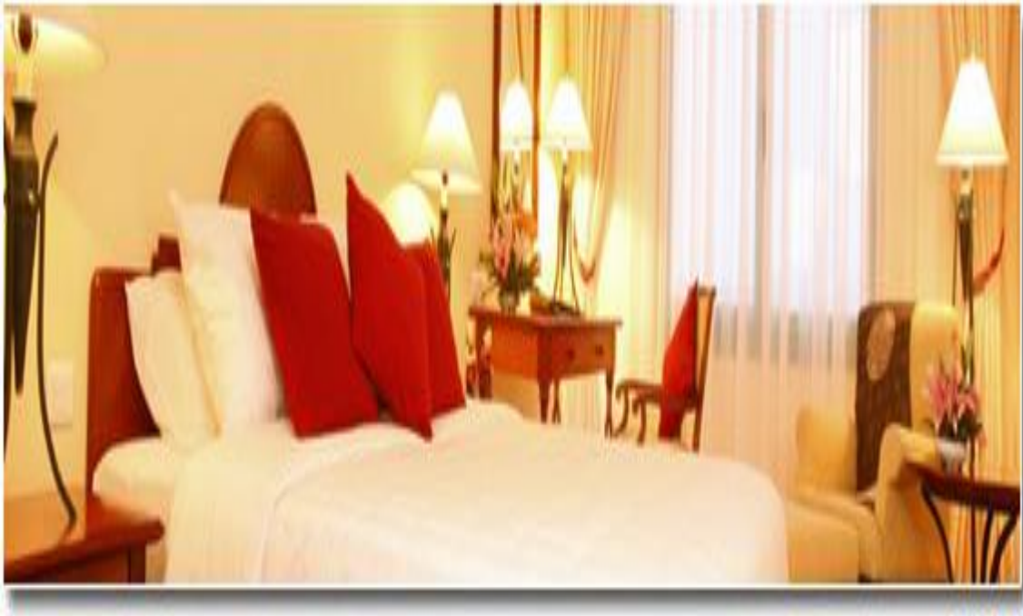
Phòng ngủ tại khách sạn Harbourview, Hải Phòng