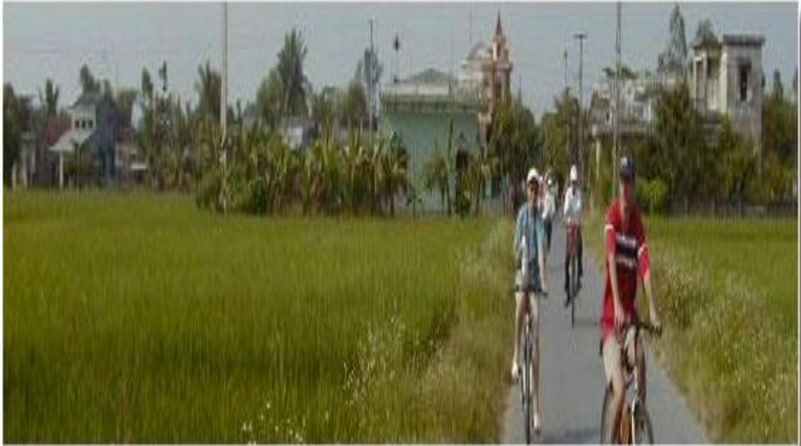
Tour du khảo đồng quê bằng xe đạp