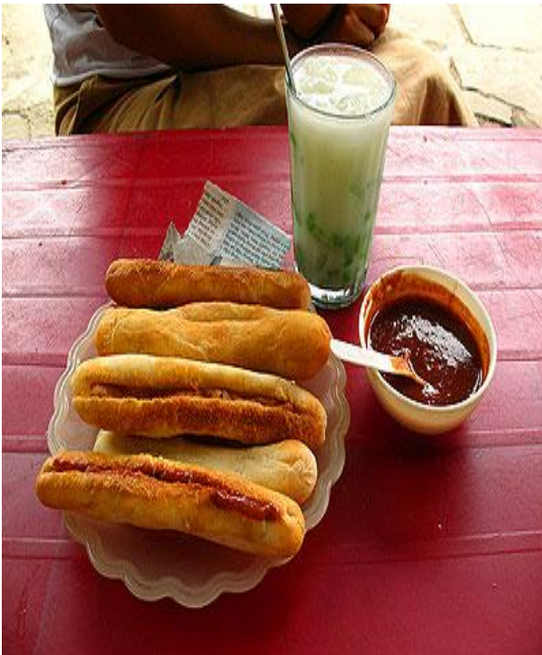
Bánh mì cay