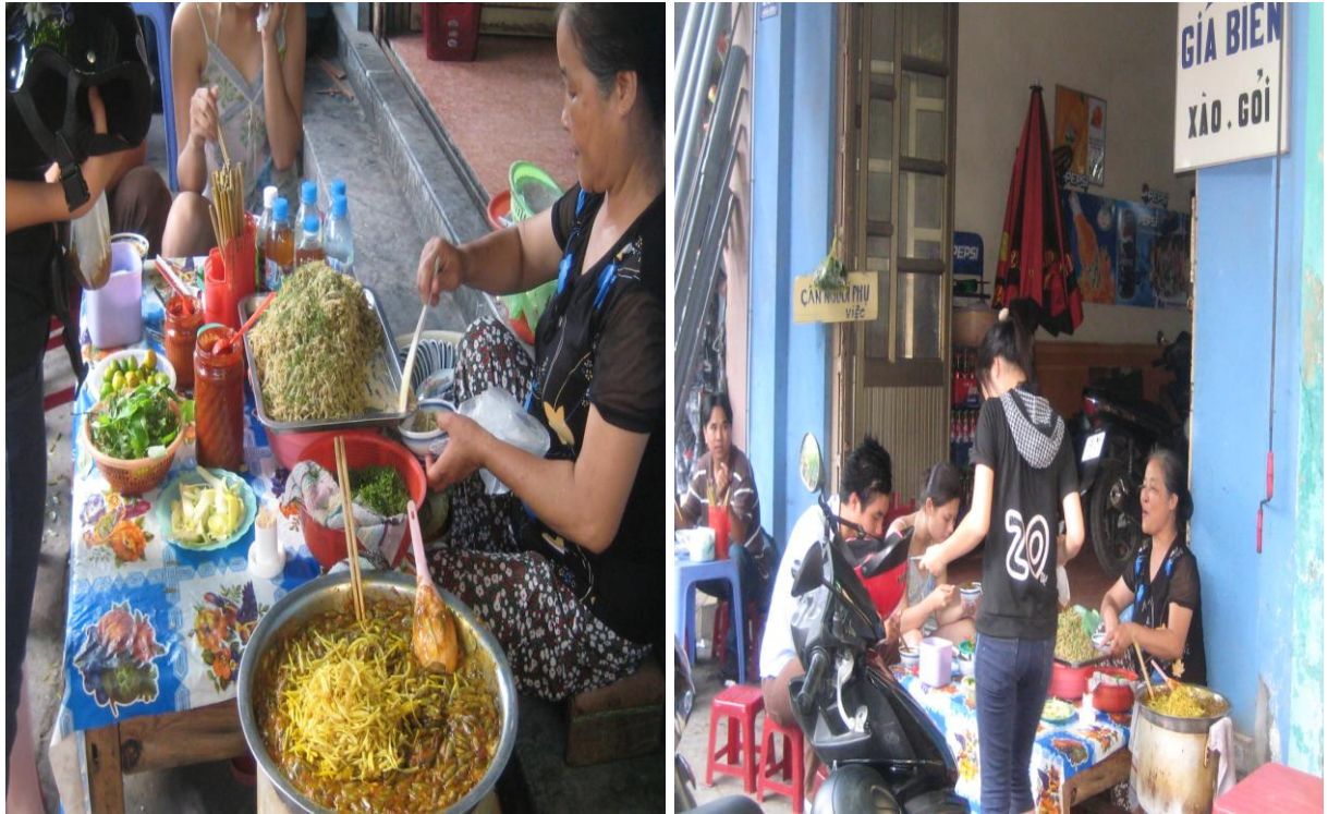
Giá biển - số 131 Hàng kênh