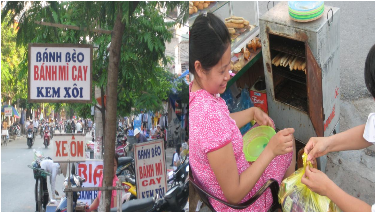
Bánh mì cay - số 54 Lê Lợi