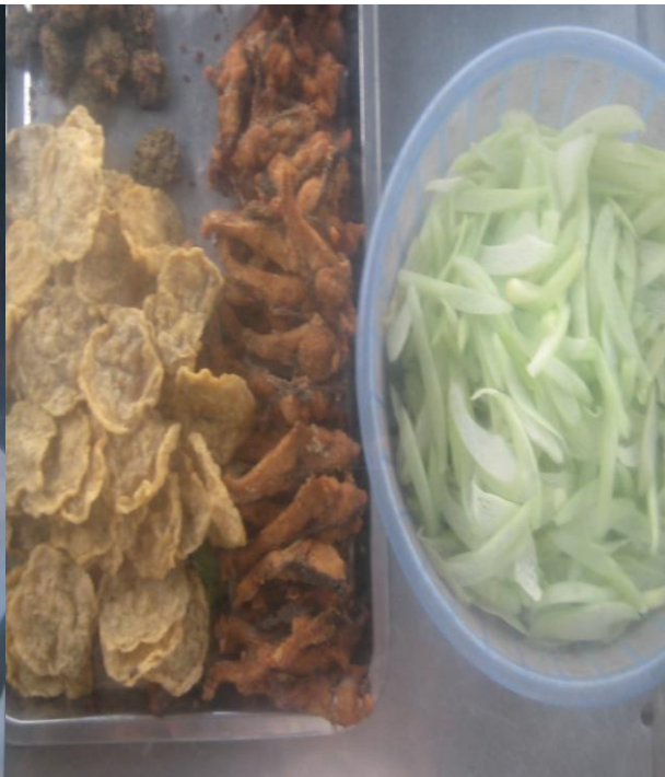
Bún cá - số 303 Lê Lợi