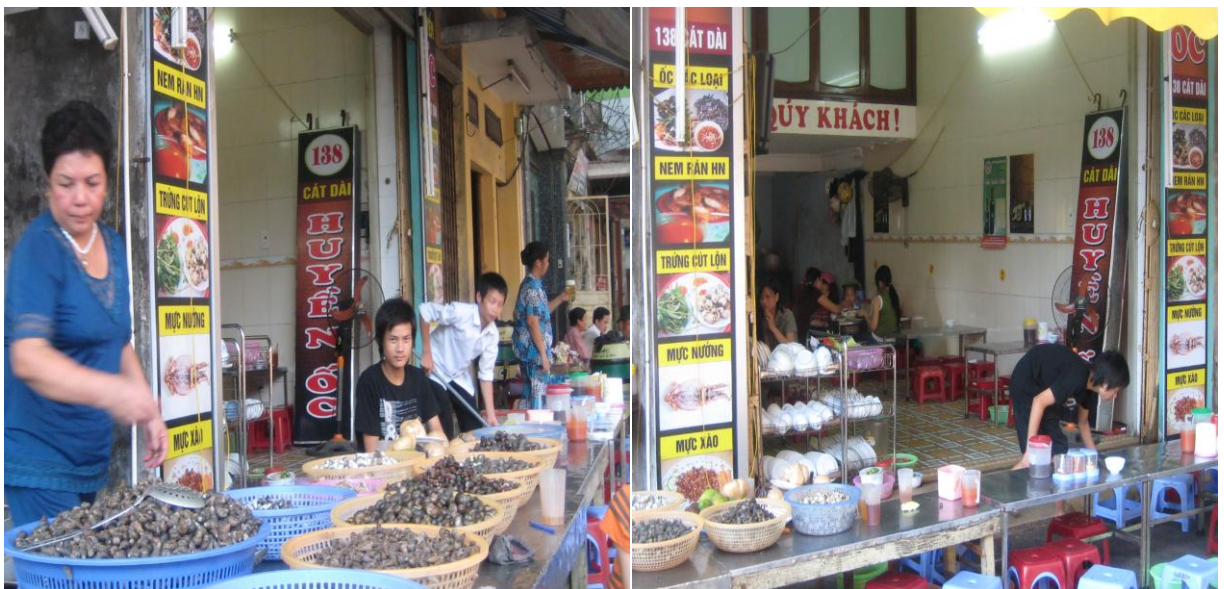
Ốc - số 138 Cát dài