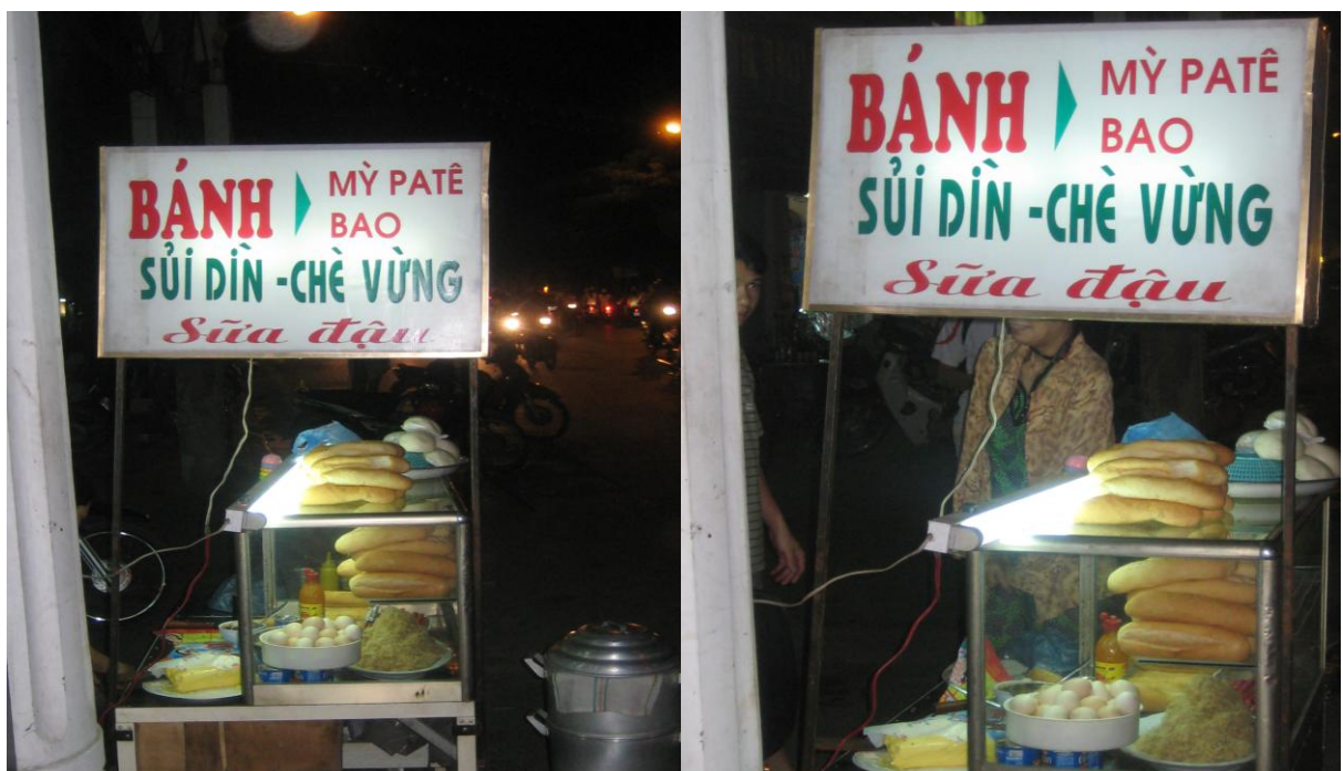
Sủi dìn - Chè vừng ngõ 46 Lạch tray