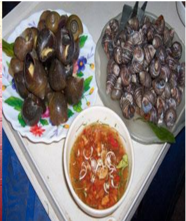
Ốc xào - luộc