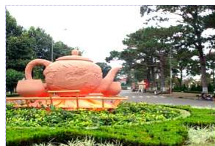
C¶nh Lô héi Trư ViÖt 2008