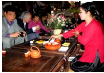
Hoạt động văn hóa trà Việt 2008