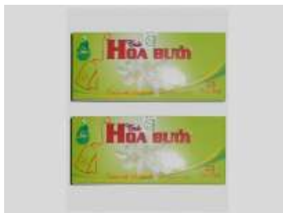
Trụ hoa B-êi