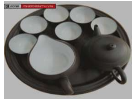
Ấm song Èm