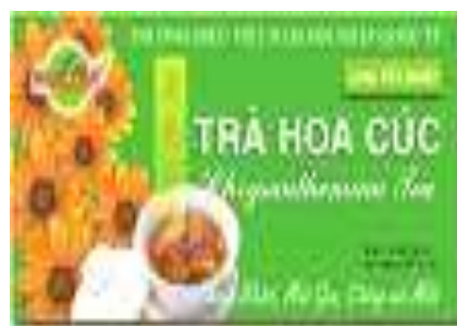
Trụ hoa Cúc