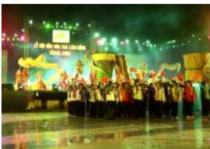
Lô héi trư L©m §ãng lÇn 2 - 2008