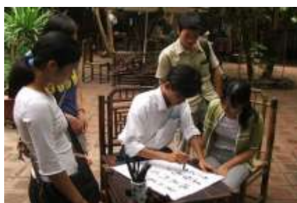
Trụ viÖt qu, n