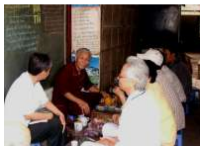
Mét gãc L- trụ Qu, n