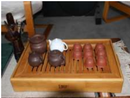
Ấm quÇn Èm