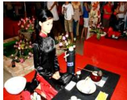
Bụi kiêu trà cuối khóa của các chị em