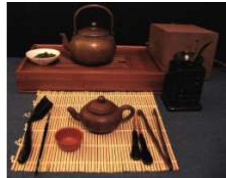
Ấm song Èm