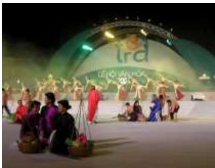
Lô héi trư §µ L't 2006