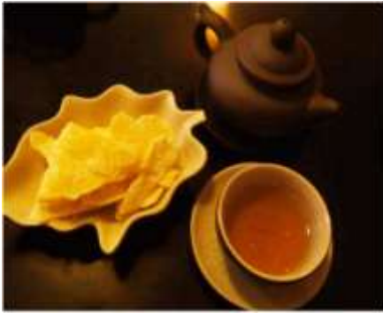
Ấm ®éc Èm