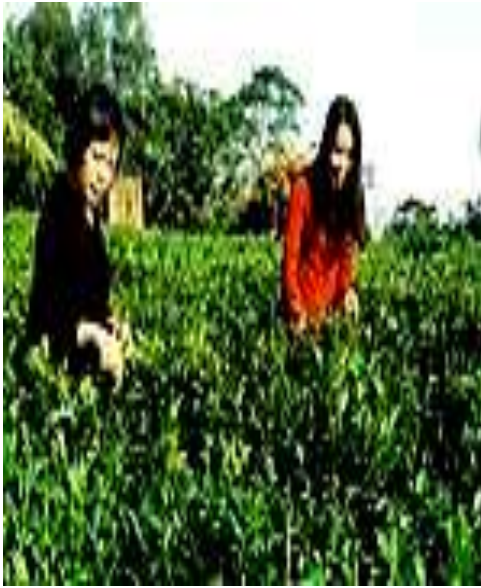
Cây trụ Việt Nam