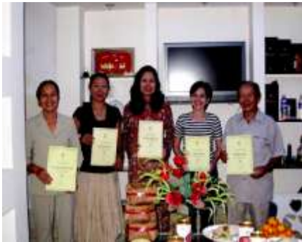
Lễ trao bằng tốt nghiệp lớp trà